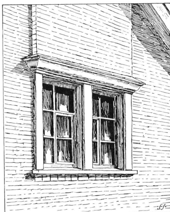
Gegenbeispiel: Wie heutzutage die Rückseitenfenster hässlich und langweilig gemacht werden.