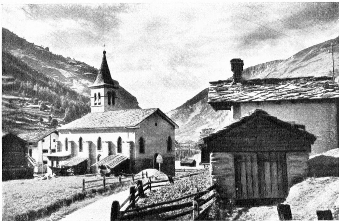
Signes de beauté: une chapelle vient d'être édiée aux Haudères, conformément au style architectonique de la contrée: toit couvert de dalles, clocher en cailloux roulés. A l'intérieur, fresques du peintre F. de Ribaupierre. — Das Verständnis für den Zusammenklang der Bauwerke setzt wieder ein. In Haudères bei Evolena wurde eine Dorfkirche gebaut, die mit Steinplatten bedacht wurde; der Turm ist aus Feldsteinen errichtet. Im Innern Fresken von Ribaupierre.