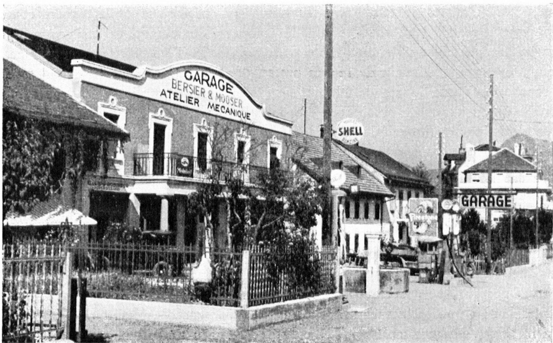
Ancienne maison foraine des Préalpes, érigée en garage. A l'arrière-plan, une maison badigeonnée en mauve. Fils, poteaux, affiches, écriteaux se concertent pour annoncer le progrès... et enlaidir un honnête quartier. — Altes Wohnhaus aus den Voralpen, das zur Garage umgebaut wurde. Im Hintergrund vor einem malvenfarbig getünchten Haus: Drähte, Telegraphenstange, Schrifttafeln und Plakate als Kennzeichen des Fortschritts und der damit verbundenen Hässlichkeit.