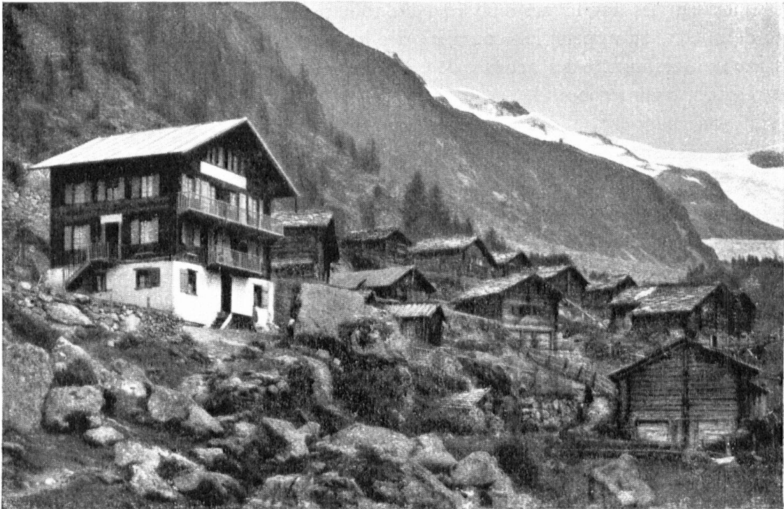
L'auberge de Ferpècle formerait avec le hameau un ensemble convenable si elle n'était coiffée de la lugubre tôle. — Eine Gruppe echter Alphütten mit einem falschen und geleckten Chalet links, das mit Blech eingedeckt ist.