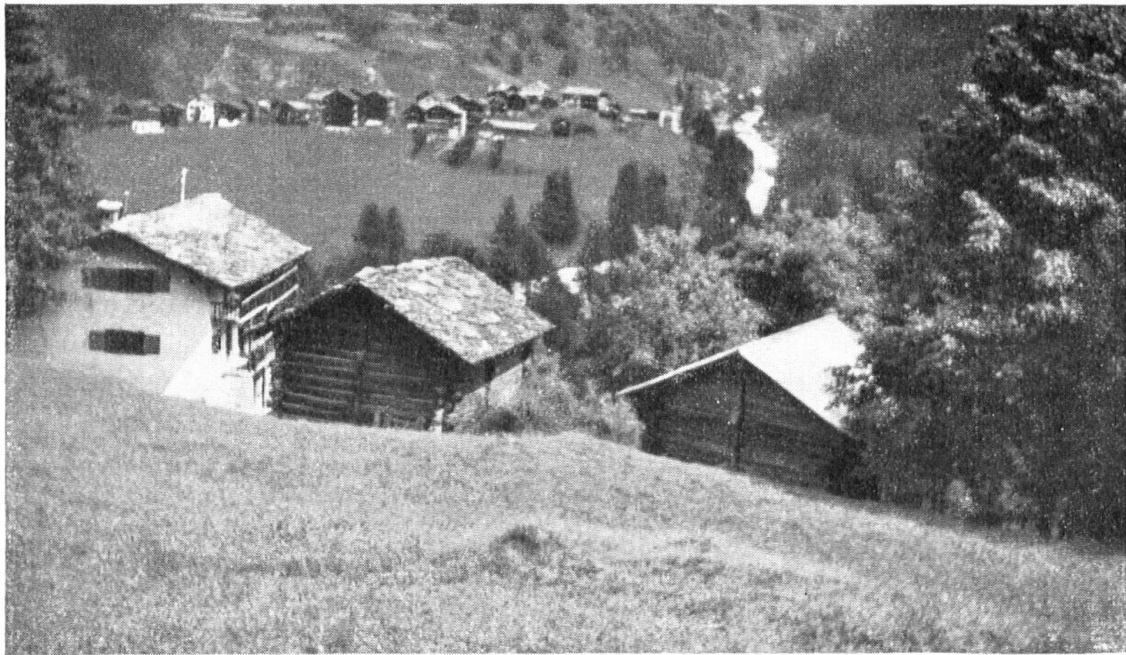
A droite, un toit de tôle brutal détruit l'harmonie naturelle de ces maisons dont la pierre et le bois sont enfants du pays valaisan. — Das Haus rechts erhielt ein Blechdach, das die reizvolle Stimmung des Dorfbildes in roher Weise zerstört. Die ländliche Bauart ist durch Holz und Stein bedingt und erträgt kein glitzerndes Blech.