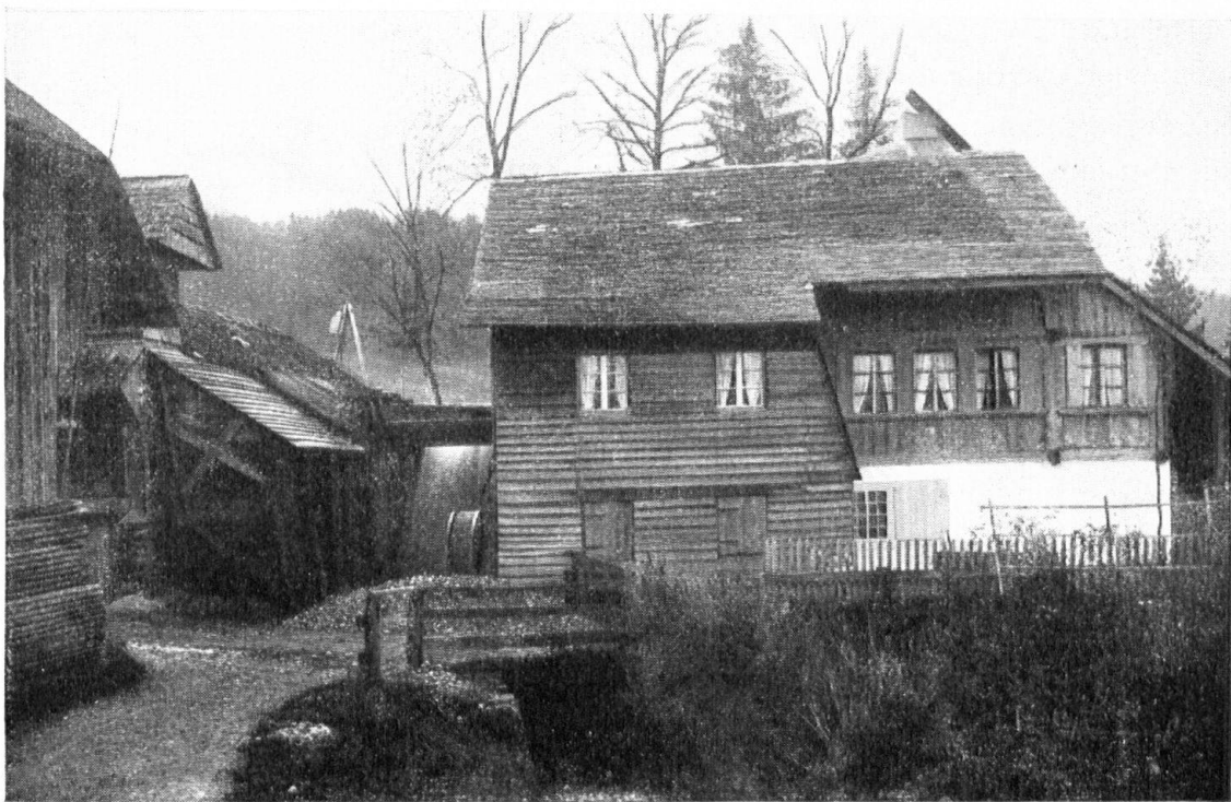
Vieille scierie, près de Bulle. Toit de bardeaux, intelligemment entretenu. Ce genre de couverture n'est plus autorisé que pour les demeures isolées. — Alte Säge bei Bulle mit verständig gepflegtem Schindeldach. Leider ist dieser Dachbelag nur noch bei freistehenden Häusern erlaubt.