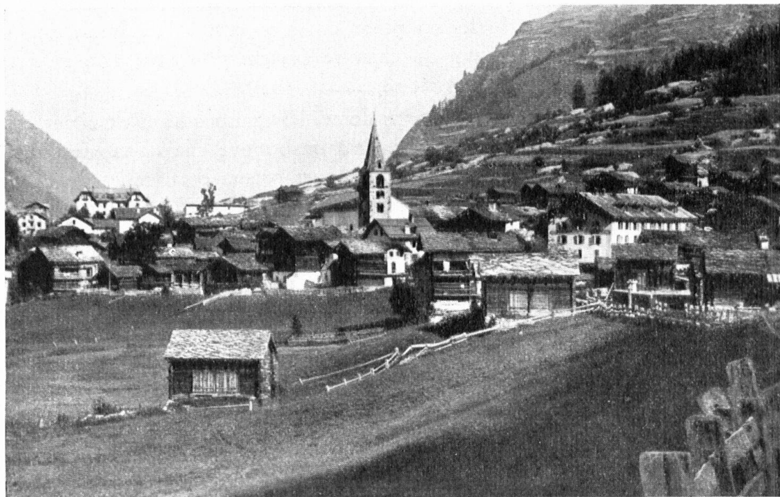
Dégâts anciens d'un beau paysage. — Le village d'Evolène affligé d'hôtels disproportionnés. — Verwüstung einer unserer schönsten Landschaften. Evolena im Wallis mit einigen Grossbauten, die sich nicht ins Dorfbild fügen.