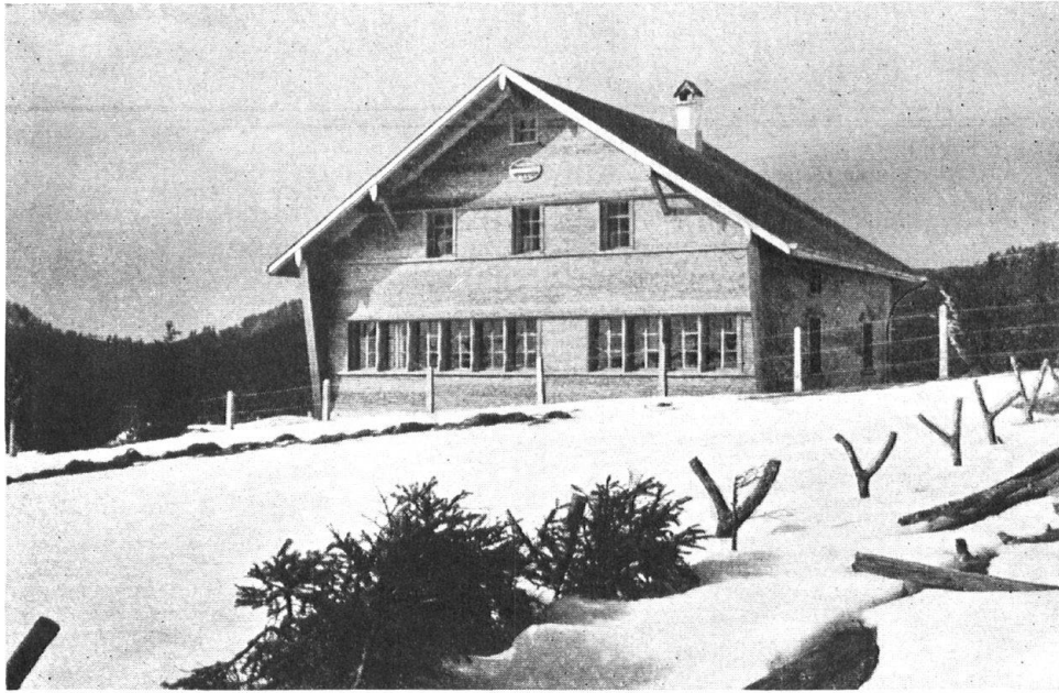
Kammhaldenhütte der Sektion Säntis des S. A. C., erbaut 1932

Die von der Sektion Säntis des Schweiz. Alpenklubs gebaute Unterkunftshütte auf der Kammhalde am Nordfuss des Säntis repräsentiert die appenzellische bodenständige Bauart in bester Form bei aller wohlausgedachten Zweckmässigkeit im Innern. Der provisorische «Krisenhag» auf der Frontseite wird durch eine kleine Trockensteinmauer ersetzt werden.