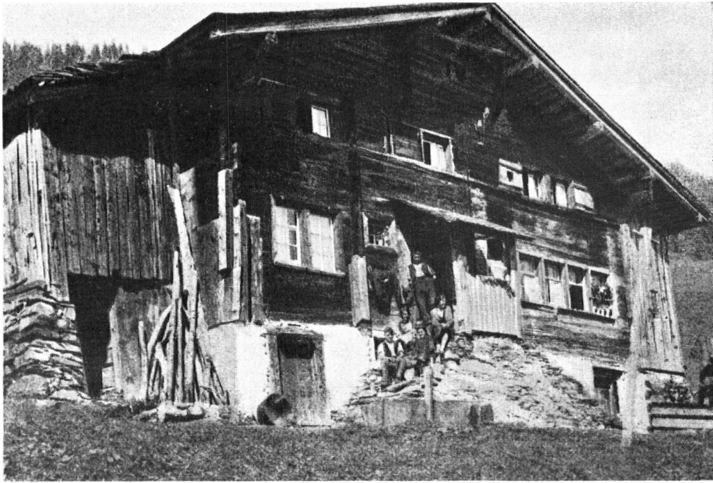
Bauernhaus in Hintersteinibach bei Elm.