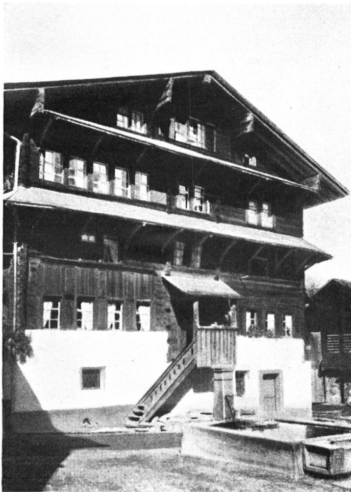
«Grosshaus» in Elm.