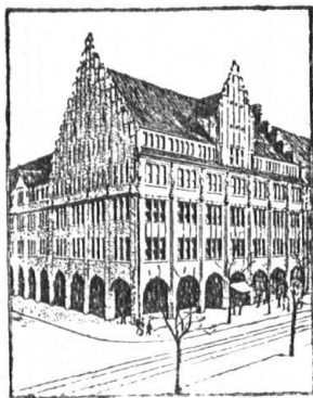
Hauptsitz: Bahnhofstrasse 32