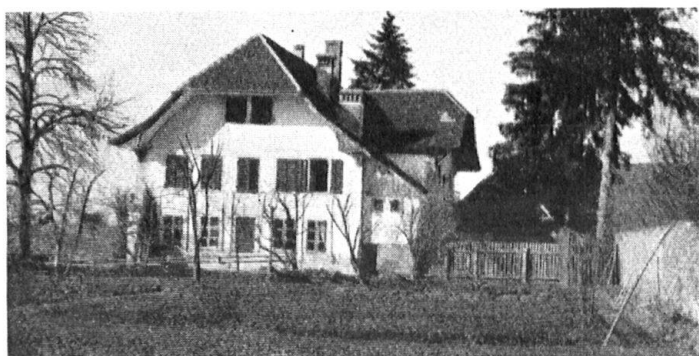
Oben: Eingang in das Dörfchen Richterwil. Links: Das Herrschaftshaus im alten Zustand. Unten: Das erneuerte Herrschaftshaus.