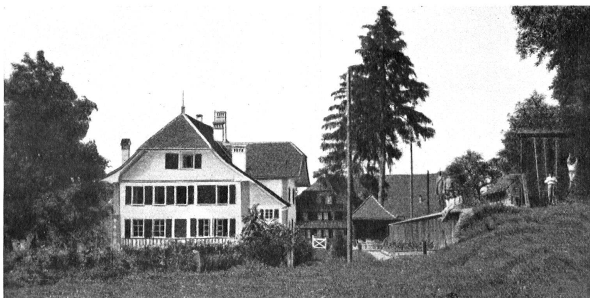
En haut: l'entrée du petit village de Richterwil; à gauche: la maison de maître avant les ré- parations; en bas: la maison de maître rénovée.