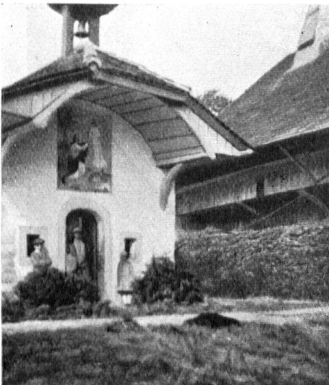
Kapelle und Pächterhaus im alten Zustand.

Un de nos lecteurs nous envoie la photographie d'une ancienne maison de campagne à Richterwil, dans le canton de Fribourg, qui, lorsqu'il l'a reprise, était dans un état de complet délabrement, et qui est devenue par ses soins un agréable séjour de villégiature. La chapelle est charmante; la ferme en bois et la maison de maître ont l'air très confortables. Voilà un exemple à imiter!