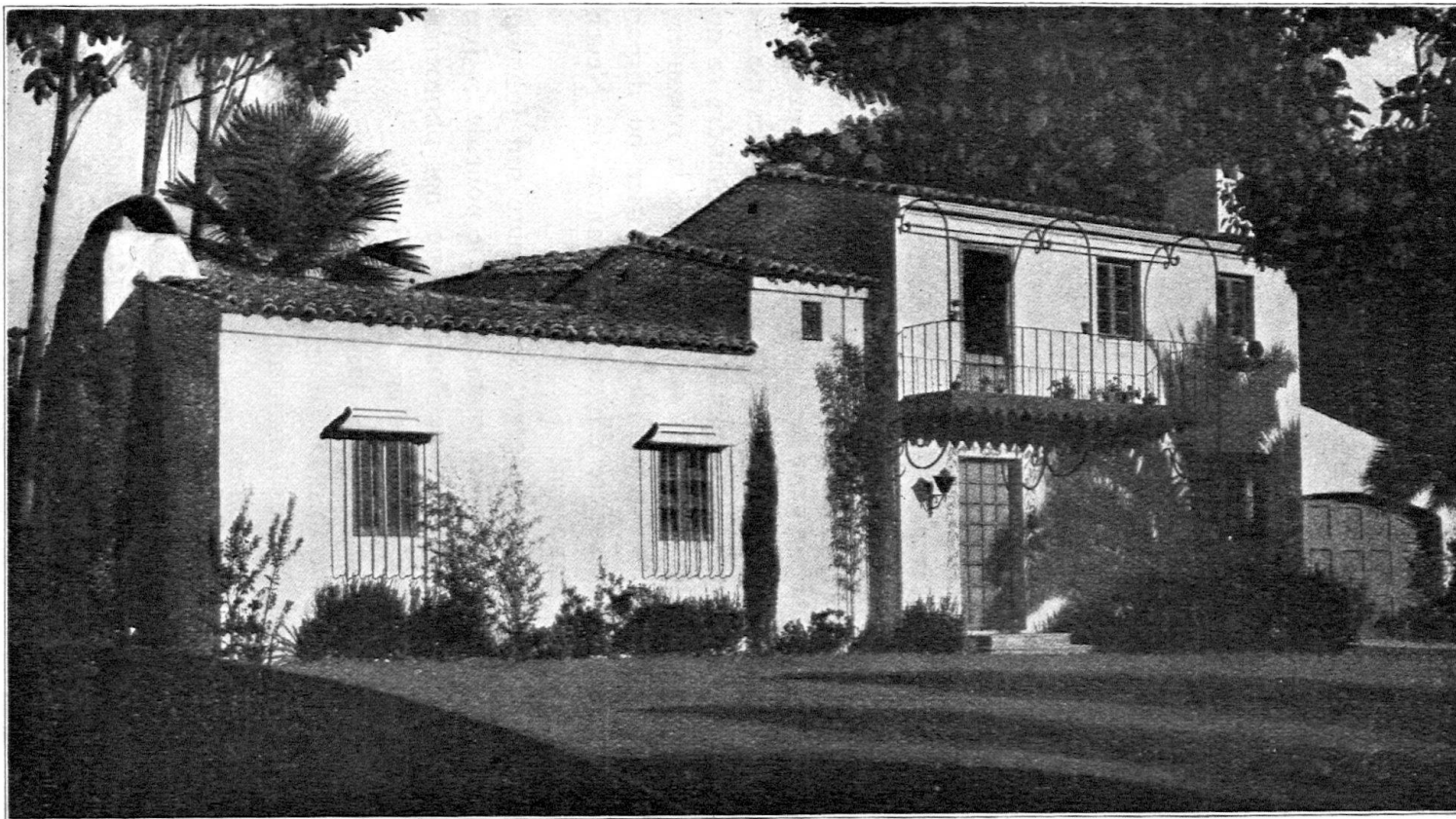
Landsitz in Pasadena, Kalifornien. — Maison de campagne à Pasadena, Californie.

.... leider nicht im Tessin .... qu'on ne rencontre malheureusement pas au Tessin