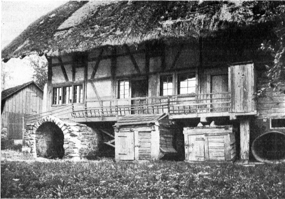
Abb. 4. Bauernhaus mit Strohdach in Hüttikon. — Fig. 4. Maison couverte de chaume à Hüttikon.

Der Rauch der Küche stieg frei in eine Art Gewölbe empor, das einen grossen Teil der Küche bedeckte. Es war dies ein aus Ruten geflochtenes, helmartiges Gewölbe, das beidseitig mit Lehm beworfen und ausgeglättet war. In dieser «Chemihutte» (Chemi = Kamin, Hutte = geflochtener Tragkorb für Rückenlasten) hingen die Speckseiten, die «Hammen» und die Würste. Zwei seitliche Oeffnungen erlaubten dem kaltgewordenen Rauch den Austritt und er verzog sich unter das mächtige Strohdach, alles Holzwerk schwärzend, zugleich aber auch die zum Binden verwendeten Weidenruten und Strohseile mit Holzteer durchtränkend, so dass sie Generationen lang ihren Dienst taten, ohne von Fäulnis angegriffen oder von Würmern zerfressen zu werden.