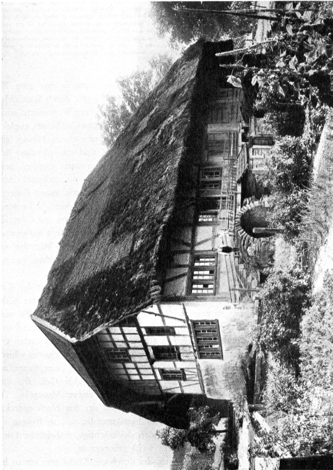
Abb. 2. Bauernhaus mit Strohdach in Hüttikon, Kt. Zürich. — Fig. 2. Maison couverte de chaume à Hüttikon, canton de Zurich.