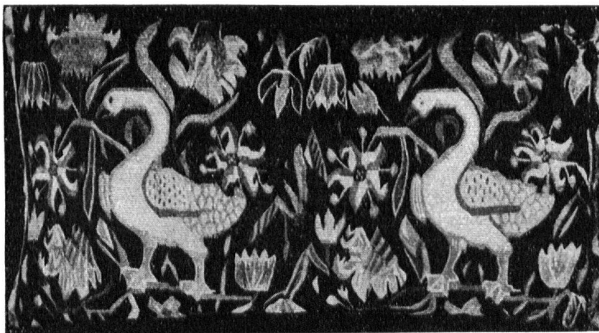
Abb. 12. Kopie eines kleinen Wandteppichs. — Fig. 12. Copie d'un petit gobein.

Alle diese Arbeiten sind von der Heimarbeitsvereinigung Malmö ausgeführt. — Tous ces travaux ont été exécutés par la Société pour le développement du travail domestique à Malmö.