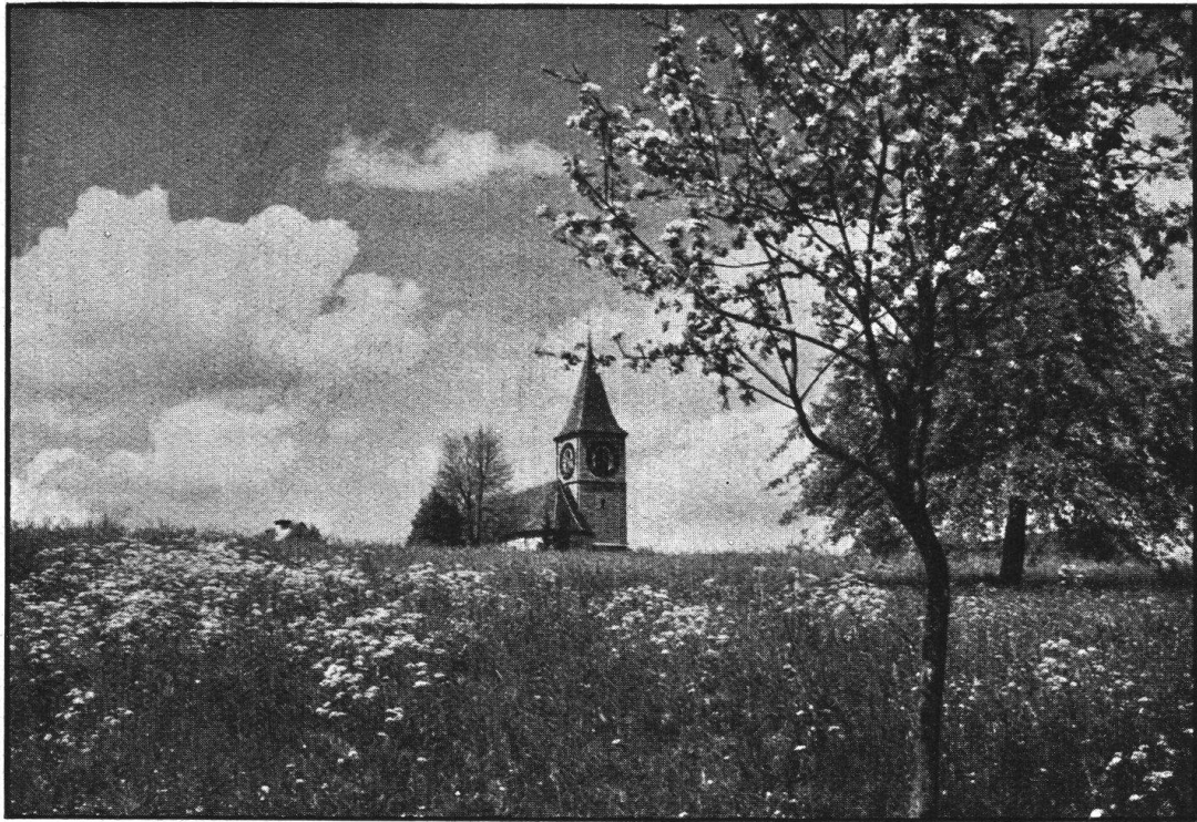
Abb. 6. Das Kirchlein von Kilchberg. Wehrli-Verlag Kilchberg. — Fig. 6. La petite église de Kilchberg. Wehrli, éditeurs, Kilchberg.