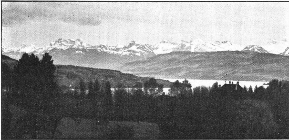
Abb. 5. Aussicht von der Kirche über den Broëlbergpark. Fig. 5. La vue dont on jouit de l'église sur le parc «Broëlberg».