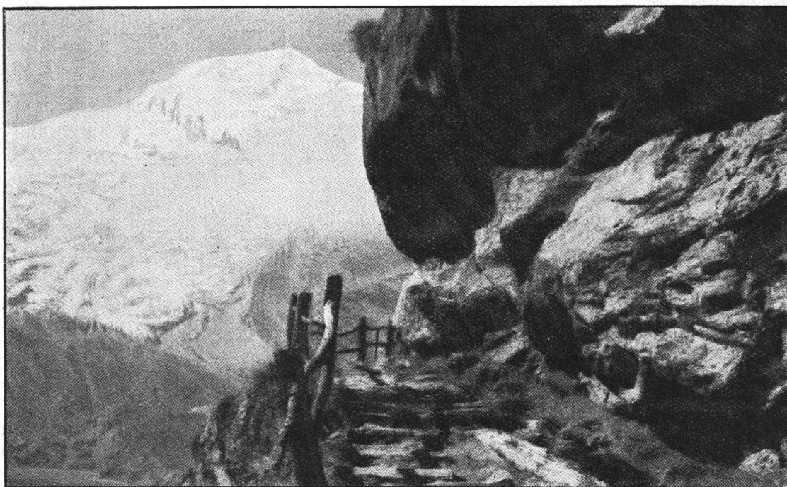
Abb. 3. Felsentreppe am Kapellenweg von Saas-Fee, der, unberührt durch die neue Autostrasse, erhalten bleiben sollte. Fig. 3. Escalier taillé dans le roc, qui mène à la chapelle de la «Hohe Stiege», et qui ne serait pas entamé par la nouvelle route.