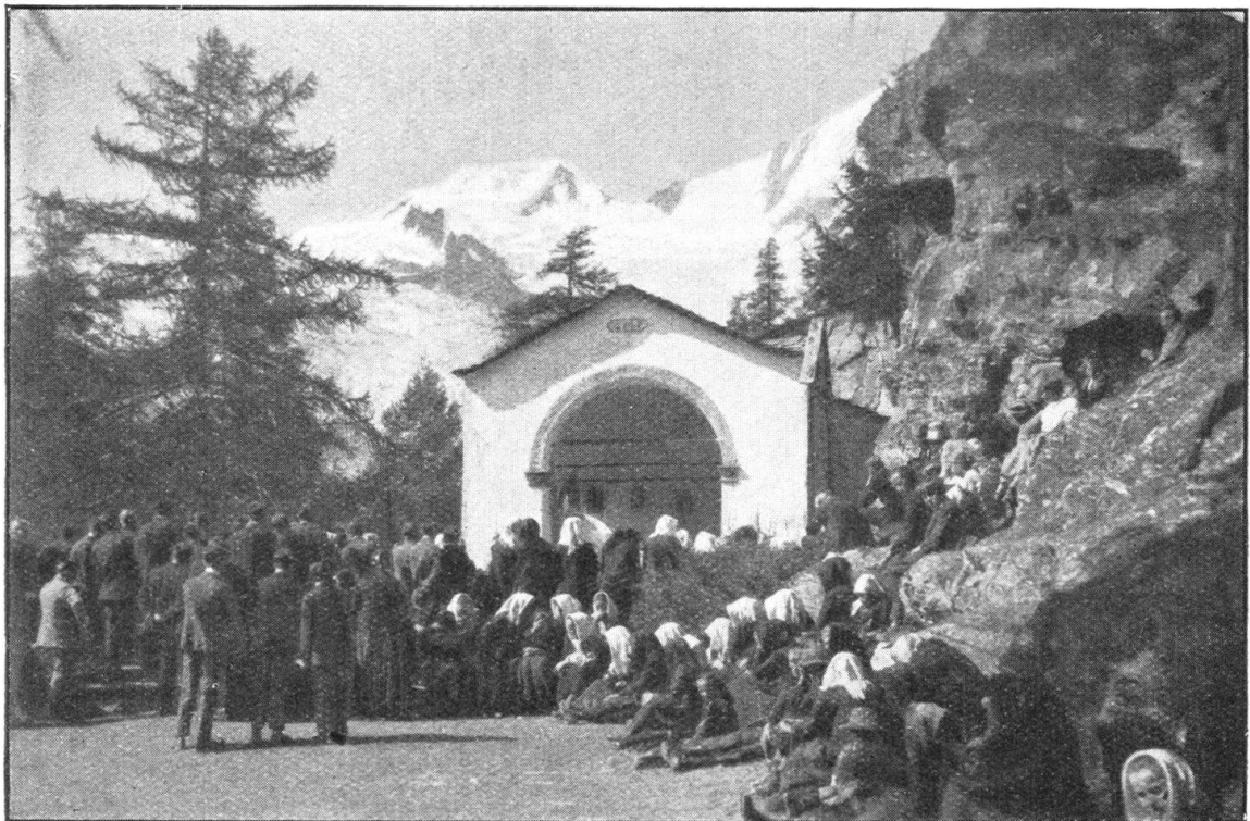
Abb. 2. Terrasse vor der Kapelle zur „Hohen Stiege“, die durch die Autostrasse zerschnitten würde. Fig. 2. La terrasse devant la chapelle de la «Hohe Stiege», qui serait coupée par le tracé de la nouvelle route automobile.