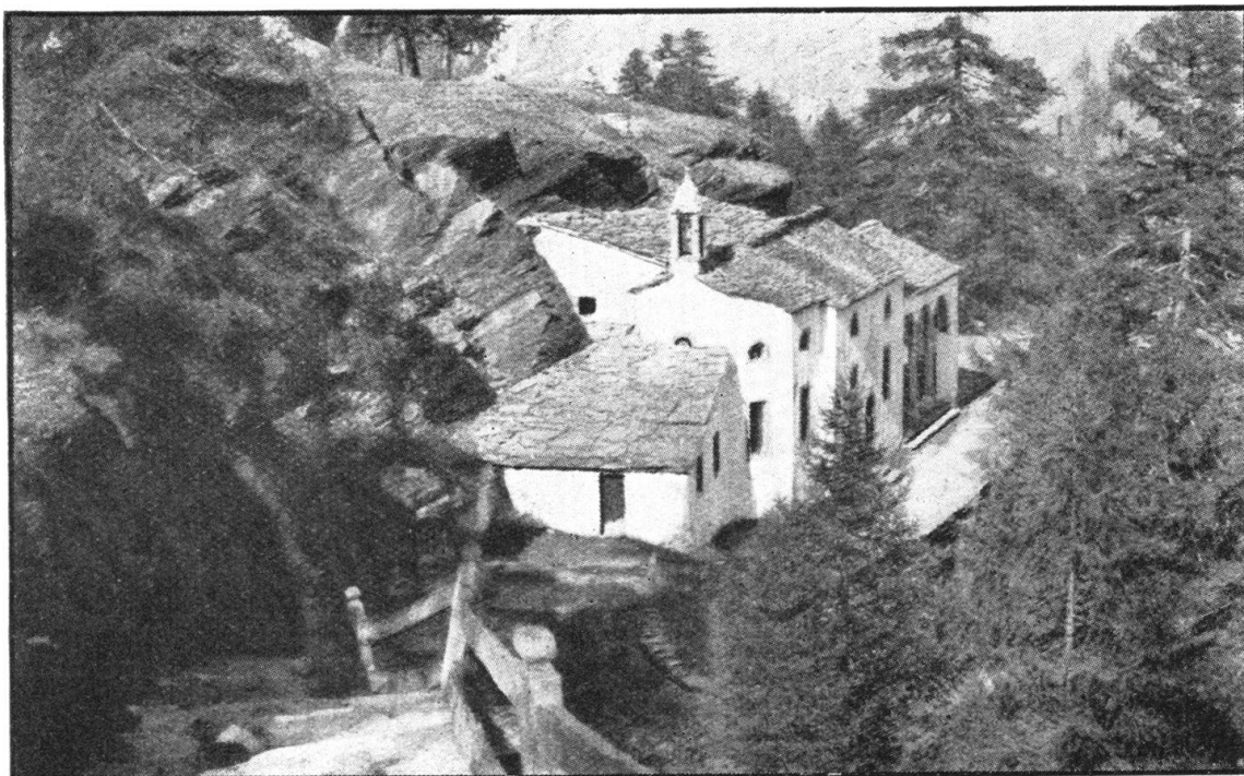
Abb. 1. Wallfahrtskapelle zur „Hohen Stiege“ bei Saas-Fee, deren Zauber durch eine dicht darum herumführende Autostrasse völlig zerstört würde. — Fig. 1. La chapelle de la «Hohe Stiege», près Saas-Fée, but célèbre de pèlerinage. Le charme incomparable de ce beau paysage est menacé par la construction projetée d'une route automobile.