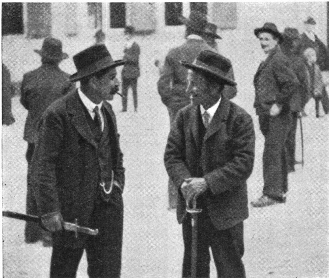
Abb. 14. Landsgemeinde-Typen. — Fig. 14. Types de citoyens se rendant à la Landsgemeinde.

ehrwürdigen und schönen Brauches als einer Quelle innerer Sammlung und patriotischer Begeisterung sich zur Aufgabe machen. Sie tun's für ihre Heimat, und ein „grosses stilles Leuchten“ am vaterländischen Ehrentage wird ihr Lohn sein.