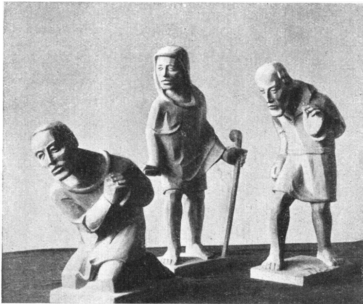
Abb. 20. Die Hirten aus der Weihnachtskrippe von E. Fuchs. Man beachte die ausdrucksvolle Einfachheit und die gute Charakterisierung jeder Figur. — Fig. 20. Les bergers devant la Sainte Crèche, par E. Fuchs, Bâle. Remarquer l'art du sculpteur qui a réussi à donner un caractère personnel à chaque figure.

Bei Bildhauer Fuchs sahen wir auch wohlgelungene, das Kinderge- müt erfreuende Modelle zu Aenisbrötchenformen. Auch hier persönliche, künstlerisch lebenswahre Arbeiten, z. B. ein Dreikönigsmotiv. Ohne grossen Aufwand könnte sich eine Familie ihre eigenen Backmodelle halten, die Darstellungen, nach eigenen Wünschen und mit besonderer Beziehung auf das Persönliche und Häusliche, mit dem Künstler besprechend. Solcher Art Weihnachtskunst würde etwas Beschauliches und Innerliches eignen, zu dem man, aus dem Getriebe des Alltags, sich gern für eine Weile flüchten möchte.