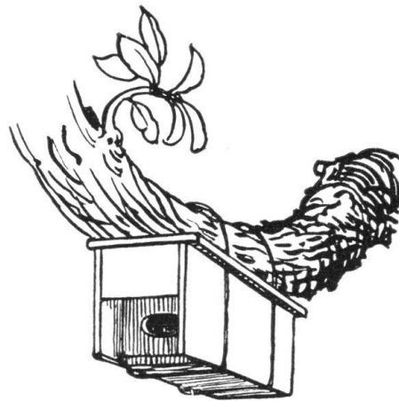
Abb. 12. Guter Nistkasten. (Abb. 11 und 12 sind Illustrationsproben aus: Ramseyer, Unsere gefiederten Freunde). — Fig. 12. Nid artificiel bien compris. (Les gravures 11 et 12 sont extraites de l'ouvrage de Ramseyer: «Nosse gefiederten Freunde»).

die noch die natürliche Baumrinde tragen und mit dem runden Flugloch und der flaschenförmigen senkrechten Höhle genau einem Spechtloch entsprechen. Diese Kästen, welche sozusagen die Tradition im Vogelreich darstellen, sind heute allgemein verbreitet. Aber bekanntlich gibt es auch am schönsten altertümlichen Bauernhaus Dinge, die man heute praktischer gestalten würde. Ramseyer glaubt, dass die Vögel beim Eintritt durch das runde Flugloch die Flügel an den Leib pressen müssen und nachher in der senkrechten Höhle auf ihre Jungen hinabfallen. Deshalb gibt er seinem Nistkästchen, das aus Brettern besteht, ein querovalen Flugloch und eine wagrechte Höhlung. Ich glaube nicht, dass die Vögel diese Erleichterung schätzen; dagegen hat die wagrechte Konstruktion den entschiedenen Vorteil, dass man das Kästchen unter einen Ast binden kann, wo ihm die Katzen nicht beikom-