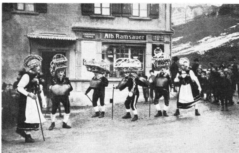
Abb. 9. Silvesterkläuse aus Herisau: neuzeitlich entartete Kostümierung. — Fig. 9. Les mascarades de la Saint-Sylvestre à Herisau. Costumes modernes d'un goût dégénéré.

Demgegenüber hat nun eine vom Vorstand der Heimatschutzsektion Appenzell A.-Rh. auf den Silvester 1927 für Herisau zusammengestellte Kläusegruppe ursprünglicher Art zu zeigen versucht, wie einfach und dabei schlicht und doch originell und dem ehemals bescheidenen Appenzellersinn und -geist besser angepasst jene früheren Silvesterkläuse waren, deren sich ältere Leute noch gerne erinnern. Diese Heimatschutzkläuse, für welche sich acht Realschüler zur Verfügung stellten, haben denn auch viel Freude gemacht. Sie wurden nicht nur bestaunt, sondern auch, wie es den Kläusen gegenüber Brauch ist, mit Geldgaben in so reichlichem Masse bedacht, dass in den polizeilich für das