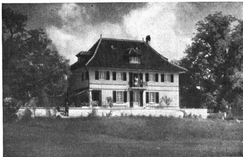
Abb. 17. Geschonte Nussbäume. Neuerbautes Landhaus bei Solothurn. Für die Wahl des Bauplatzes waren die beiden uralten Nussbäume rechts und links massgebend, die nun den schönsten, lebendigen Rahmen für das Haus bilden. — Fig. 17. Épargnons les beaux noyers! Maison de campagne, construite dernièrement près de Soleure. Ces deux vénérables noyers, qui maintenant encadrent pittoresquement la villa, ont déterminé l'emplacement de celle-ci.

gen, für die der Wettbewerb nur begleitend war und die uns auch nicht aus dem erwähnten Heimatschutzheft bekannt sein konnten. Von weitaus den meisten dieser modernen Grabzeichen darf man sagen, dass sie mit sicherem Gefühl aus dem Material gewonnen sind, gefunden, nicht «gesucht». So mögen sie dem Handwerksmeister zu Stadt und Land Anregung geben; die Mappe ist aber auch da, um vom Pfarrer oder Lehrer den Trauerfamilien gezeigt zu werden, die etwa Rat holen für die Schaffung eines Grabzeichens. Wenn die Veröffentlichung recht oft als Wegleitung benützt wird, könnte sich manches in unserer Friedhofkultur zum Besseren wenden; die knappen Ausführungen über Rostprozess und Rostschutz, die der Basler Fachlehrer für Schlosserei, F. Herger, zum Ganzen beisteuert, wird auch der Laie mit Gewinn lesen, da die üblichen Befürchtungen wegen Wetterunbeständigkeit der Eisenkreuze durch Exempel aus der Praxis zerstreut werden.