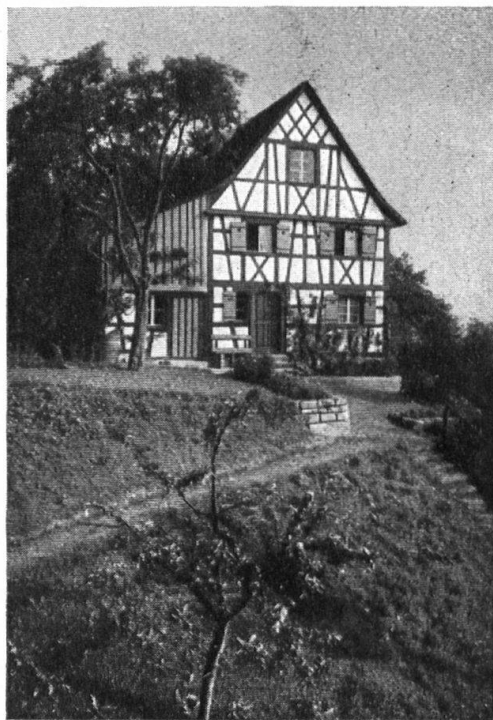
Abb. 7. Die Sonnegg, nach der erfolgreichen Renovation. — Fig. 7. Le «Sonnegg» après avoir été restauré.

Architektenarbeit zu prächtigem Abschluss gediehen und somit ihren geistigen Vätern wie den Besitzern der Bauten Ehre einbringen (Steckborn, Schönenberg, Romanshorn). Ferner diejenigen Riegelgiebel, zu welchen die Heimatschutzvereinigung zur Beratung gebeten wurde (z. B. Aspenreute, Hohentannen, Lenzenhaus).