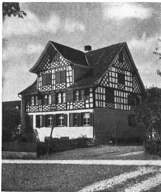
Abb. 3. Wirtschaft Lenzenhaus bei Erlen. Ein Objekt, das aus einem ziemlich baufälligen Zustande durch verständnisvolle Behandlung wieder zu seiner alten, schönen Wirkung gebracht wurde. — Fig. 3. Restaurant Lenzenhaus près Erlen. Ce bâtiment qui se trouvait dans un état de regrettable délabrement a été dernièrement restauré avec goût et a ainsi retrouvé son cachet primitif.

wesens wieder etwas besser zu erinnern und das sichtbar zu demonstrieren, viel dabei geholfen haben. Aber vielleicht ist gerade diese Strömung eine Folge der stetigen und unbeirrten Heimatschutzarbeit, und schliesslich entscheidet doch die Frucht derselben. Wenn man Freude hätte am Registrieren, so könnten diese baulichen Erneuerungen im Sinne des Heimatschutzes als Beweise, dass man sich seiner thurgauischen Behausung nicht schämt, sondern sie stolz und froh der Welt zeigt, in zwei Hauptgruppen scheiden. In die erste mögen alle die Renovationen eingereiht werden, welche durch verständnis- und liebevolle