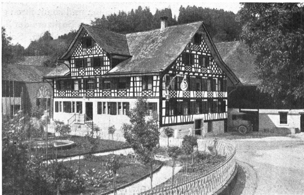
Abb. 4. Die Mühle Schönenberg bei Kradolf. Ein mächtiger, stolzer Riegelbau, der, frisch renoviert, sich mit dem Hintergrunde der Ruine „Last“ sehr hübsch ausnimmt. Aufnahme von Photogr. Geischwiler, Amriswil. — Fig. 4. Le moulin Schönenberg près Kradolf. Imposante construction en colombage, restaurée dernièrement. Avec la ruine du château de „Last“ à l’arrière-plan, elle produit un fort bel effet. Cliché de M. Geischwiler, Amriswil.