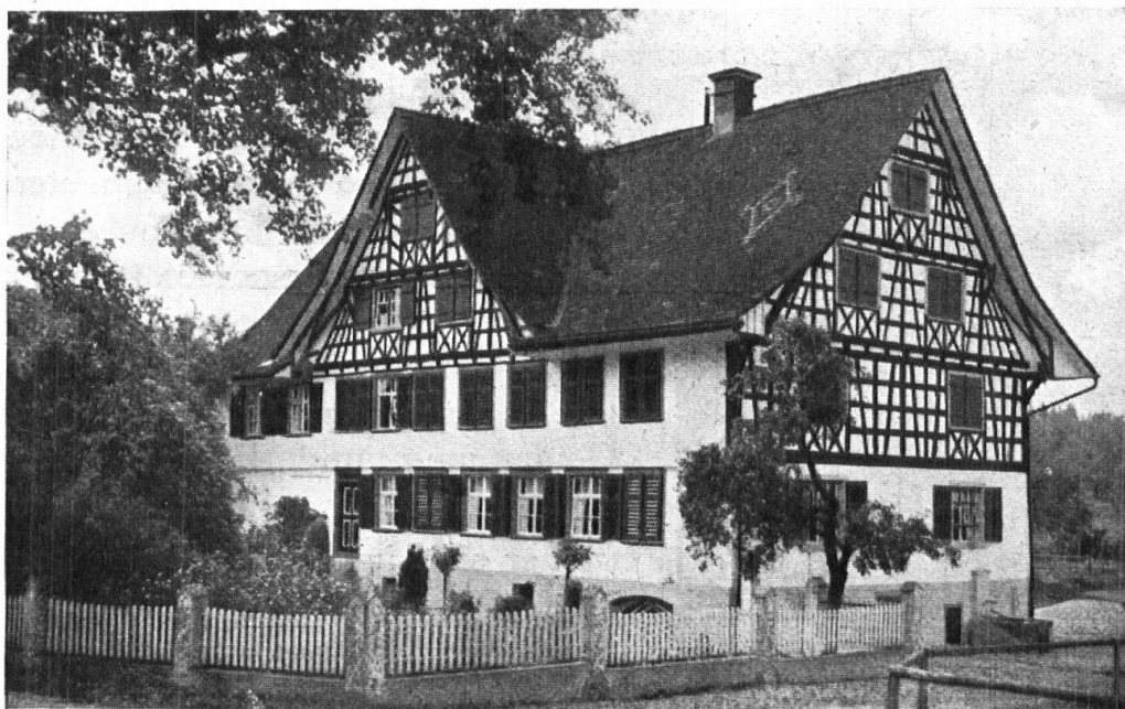
Abb. 5. Haus Lauchenauer in Aspenreuti, Neukirch a. d. Thur. Das Riegelwerk wurde bei der letzten Renovation wieder freigelegt. — Fig. 5. Maison Lauchenauer à Aspenreuti, Neukirch sur la Thur. Lors d’une rénovation récente, l’architecture en pans de bois est redevenue apparente.