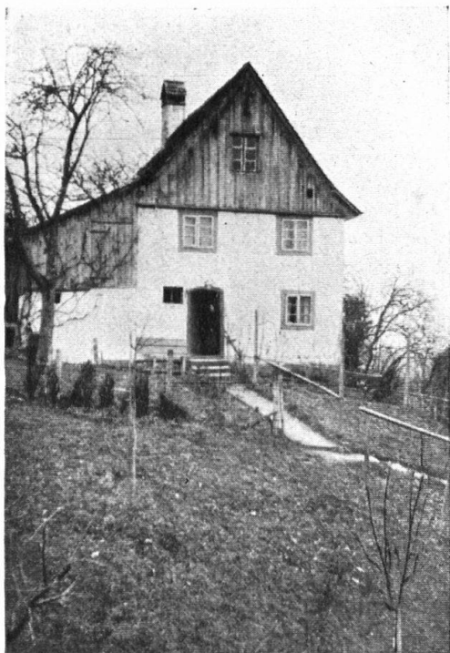
Abb. 6. Die Sonnegg in Emmishofen. Vor dem Umbau. — Fig. 6. Le «Sonnegg» à Emmishofen, avant la restauration.