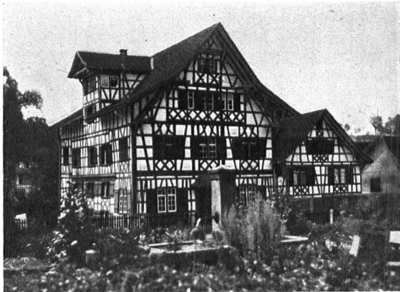
Abb. 8. Der „Spittel“ Hauptwil. Ein markanter Riegelbau mitten in der Ortschaft, der dem alten Dorfteil seinen Charakter gibt. — Fig. 8. Le « Spittel » à Hauptwil. Bâtiment en colombage, d'un beau caractère. Situé au centre de la localité il donne son originalité à la partie ancienne du village.

Die Abbildungen sind, wo nichts anderes bemerkt ist, nach Photographien des Verfassers hergestellt.