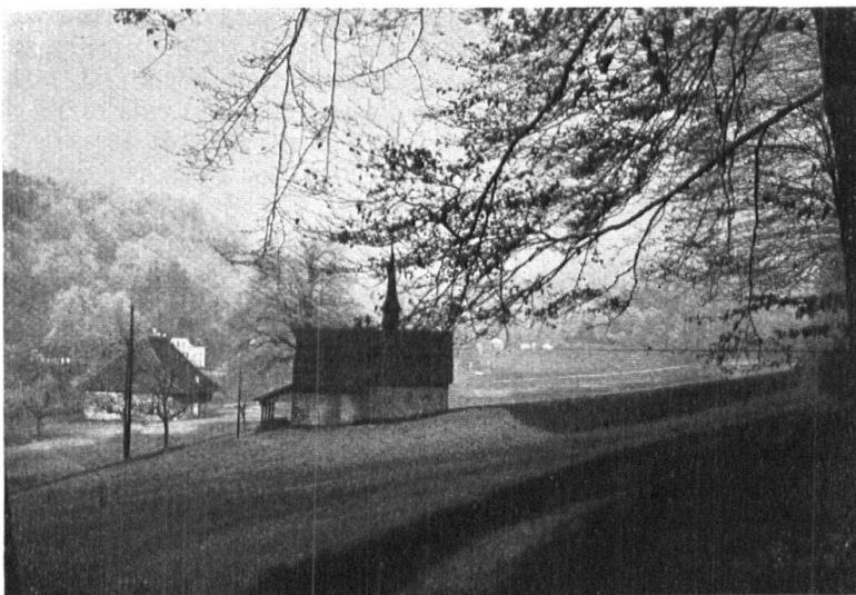
Abb. 14. Siechenkapelle und Siechenhaus in Burgdorf; ein seltenes mittelalterliches Baudenkmal und in hohem Masse erhaltenswert. — Fig. 14. L'ancienne léproserie et sa chapelle à Berthoud. Curieuses constructions datant du moyen âge et qui méritent d'être conservées.

Es hatte allerdings nach dem Hinschied des 1. Präsidenten der Naturschutzkommission, Prof. P. Morand Meyer, den Anschein, als ob die Bestrebungen, merkwürdige Naturdenkmäler, die gefährdete Tier- und Pflanzenwelt vor dem Untergang zu bewahren, ganz in Vergessenheit geraten wären. Nun nimmt der neue Präsident der Naturschutz-Kommission, Kant.-Forstadjunkt Oechslin , erfreulicherweise die Tätigkeit seines Vorgängers mit aller Energie auf und es ist sicher, dass