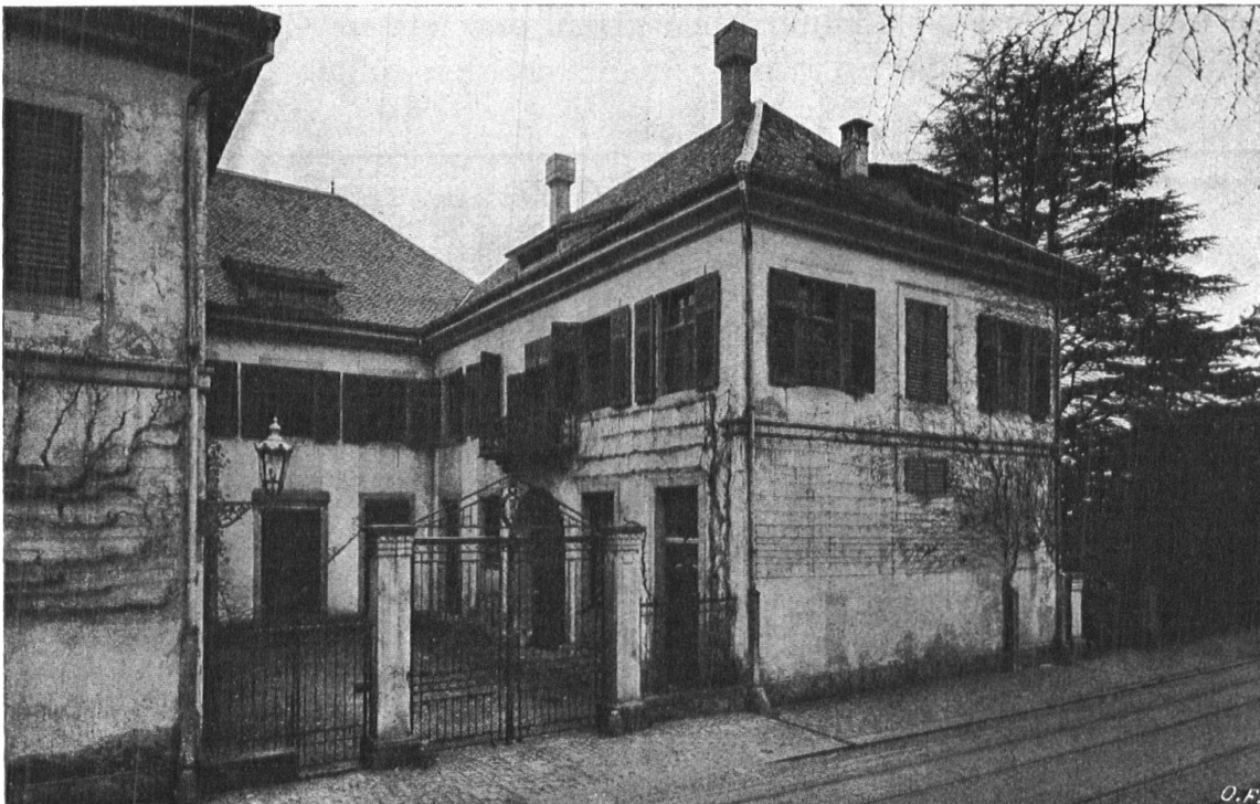
Abb. 17. Das Muraltengut. Ansicht von der Seestrasse. Die beiden Bilder zum Muraltengut sind dem IX. Band der Bürgerhaus- publikation entnommen («Das Bürgerhaus der Stadt Zürich», im Heimatschutz s. Z. angelegentlich empfohlen). Verlag Orell Füssli Zürich. — Fig. 17, La propriété de Muralt, vue de la rue du Lac (Seestrasse). Ces deux dernières vues sont extraites du IX e volume de l'ouvrage sur la Maison bourgeoise en Suisse («La Maison bourgeoise à Zurich», recommandée aux amis du Heimatschutz). Orell Füssli, éditeurs, Zurich.