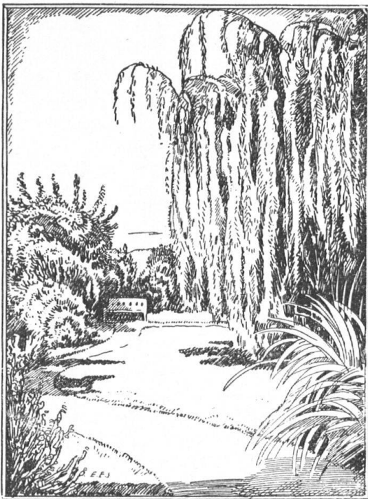
OTTO FROEBELS ERBEN GARTENARCHITEKTEN ZÜRICH 7