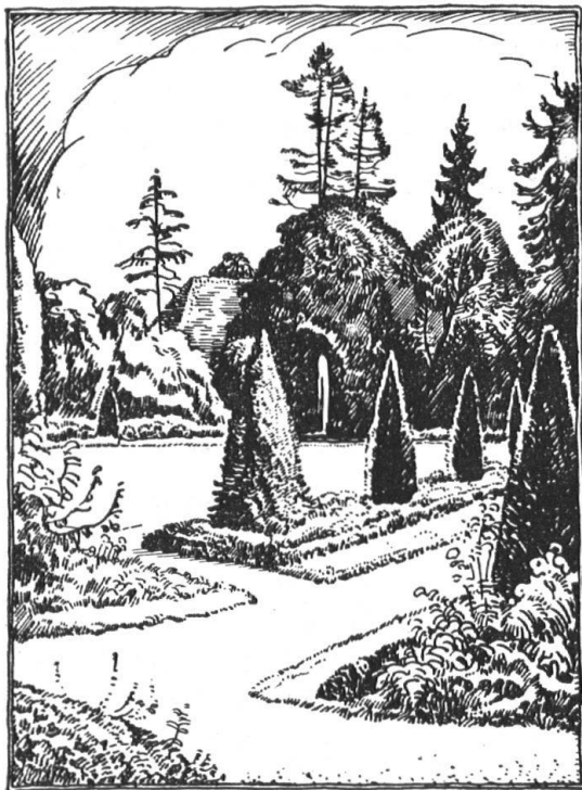
OTTO FROEBELS ERBEN GARTENARCHITEKTEN ZÜRICH 7