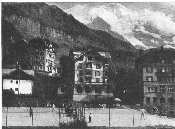
Tennisplätze des Kurverein Wengen