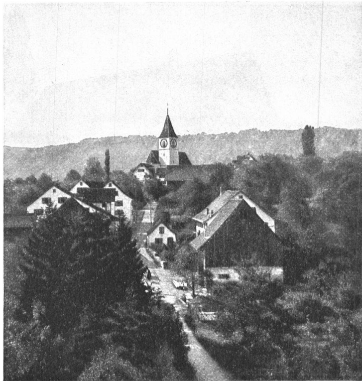
Abb. 1. Kilchberg, Dorfbild. Fig. 1. Le village de Kilchberg.

Eine sehr glückliche Gruppierung der Bauten um einen freien Platz finden wir auf Brunnen, wo unter anderen das Landhaus C. F. Meyers und das sog. rote Haus, das unseres Erachtens heimeligste Haus Kilchbergs, stehen. Eine treffliche Anordnung der Häuser beidseits der Strasse zeigen auch der Hof Böhnler und das Reihendorf Bendlikon, an dessen unterem Ende am See der „Löwen“ (bis 1837 Gemeindehaus) steht. Der „Löwen“ trug den Typus des behäbigen Landgasthofs an sich, bevor er durch An- und Umbauten entstellt wurde.