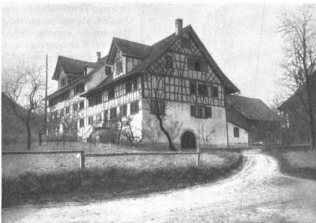
Abb. 4. Der Meierhof. — Fig. 4. Le «Meierhof».

ren aus (Pappeln, Weiden u. a.). Da steht z. B. im Navillschen Gut eine Silberweide ( Salix alba ), mit zwölf Meter Umfang in ein Meter Höhe, acht mächtigen Hauptästen, 20 Meter Kronendurchmesser und 25 Meter Höhe, wohl das mächtigste Exemplar ihrer Gattung. Im Löwengarten erhebt sich eine Blutbuche, und beim unteren Mönchhof, ob dem Hause zum Hohenrain (bei einer Scheune) und bei der Scheune an der Kreuzstrasse stehen insgesamt fünf alte mächtige Nussbäume. Stimmungsvoll wirkt auch der 1859 vom Grafen Plater im Broëlberggute angelegte Waldbestand (Föhren, Tannen, Buchen, Eichen, Weisspappeln, Kastanien) mit der weithin sichtbaren alten Föhre am „Chillewegli“. Erwähnt seien zum Schlusse noch drei mit alten schönen Baumexemplaren bestandene Feldhölzer auf dem Höhenrücken (Lettehölzli, Chillehölzli, Tüchelhölzli), welche die Gemeinde insgesamt angekauft hat, um sie vor dem Abholzen zu schützen. Leider hat man in diesen Wäldchen sämtliches Jungholz und besonders das lauschige Staudenwerk, das den Vögeln zahlreiche Nistgelegenheiten bot, ausgerottet. Es soll aber hierin anders werden, dank einer Anregung der Heimatschutzkommission.