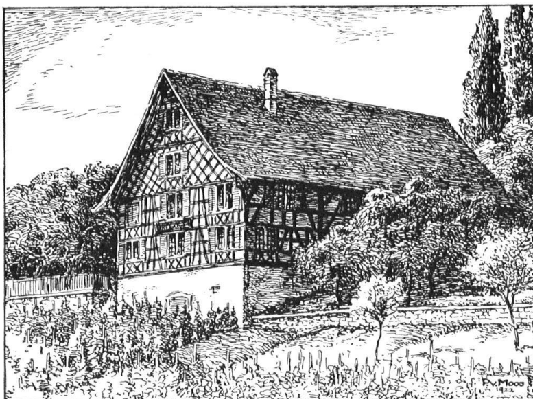
Abb. 2. Der obere Mönchhof. Zeichnung von Paul von Moos. — Fig. 2. Le «Mönchhof» d'en haut. Dessin de Paul von Moos.

gleich dem Meierhof auf Kilchberg ein echtes Weinbauernhaus mit einem Geschossunterbau für den geräumigen Weinkeller. Beide Gebäude erinnern daran, dass der Weinbau einst den Haupterwerbszweig unseres Dorfes bildete