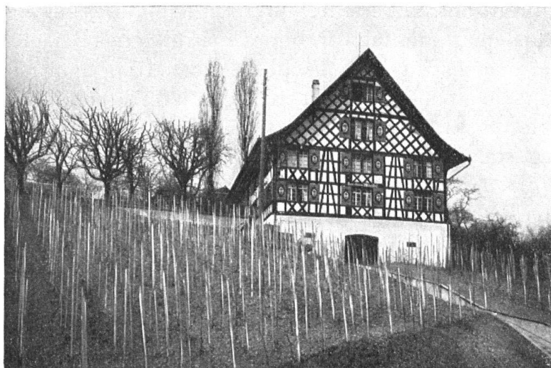
Abb. 3. Der obere Mönchhof, nach der erfreulichen Restaurierung. — Fig. 3. Le «Mönchhof» restauré avec beaucoup de goût.

Weil ehemals der Weinberg den ganzen Uferhang in Anspruch nahm, ist