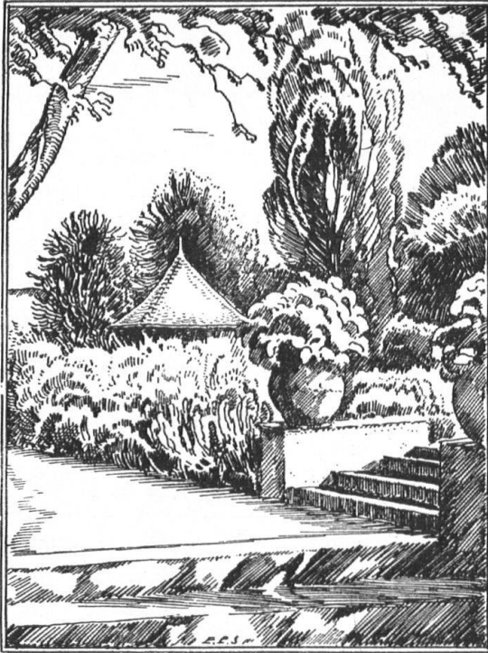
OTTO FROEBELS ERBEN GARTENARCHITEKTEN ZÜRICH 7