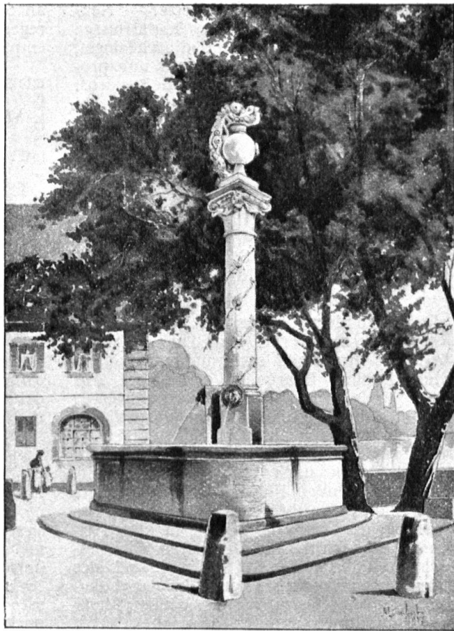
Abb. 10. Der Brunnen auf der Place d'Arve in Carouge. Zeichnung von A. Lambert. — Fig. 10. Fontaine de la Place d'Arve, à Carouge. Dessin de A. Lambert.

Dans le n° 4, Juillet-Août 1920, du Heimatschutz, paraissait un article sur les fontaines anciennes de Fribourg (Josué Labastrou, éditeur, Fribourg), annonçant du même auteur une série de publications sur les fontaines anciennes de différentes villes suisses. Le volume traitant de celles de Genève vient de paraître et confirme ce que nous disions dans notre recension des fontaines de Fribourg, que ces monuments étaient d'une grande variété. En effet, si toutes les fontaines de Fribourg respirent l'esprit de la Renaissance, celles de Genève présentent des exemples du style sobre et sévère du XVIII e et du XIX e siècles. Ici, plus de statues de saints, ou de héros sur des colonnes richement décorées de chapiteaux, de frises et de guirlandes, plus d'allégories et d'emblèmes, mais seule la recherche de la beauté des proportions et de l'élégance de la ligne. Autant la fontaine fribourgeoise paraît le complément naturel de la vieille rue pittoresque, autant la sobriété et l'élégance de la Genevoise cadrent admirablement avec l'architecture plus régulière et académique de son entourage. L'influence de l'art