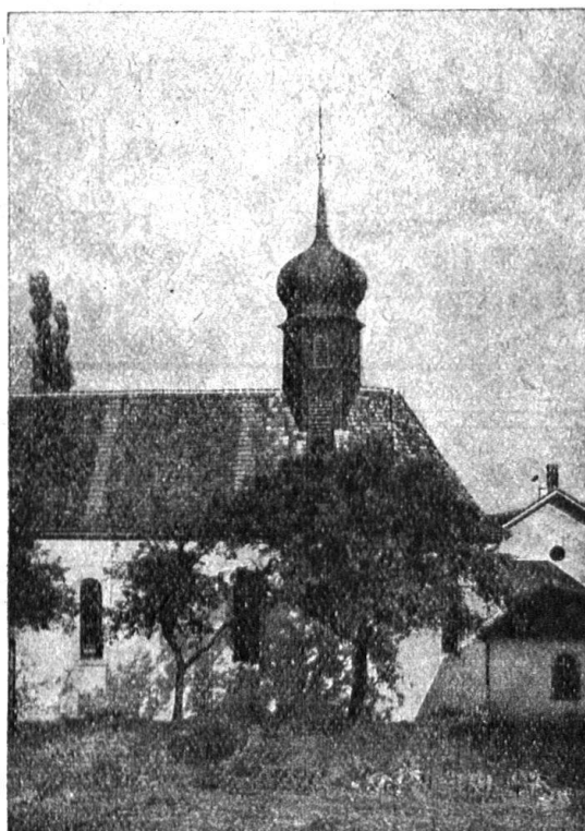
Kirche in Meiringen