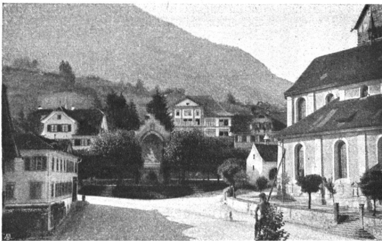
Abb. 18. Der Dorfplatz in Stans. Das Schulhaus, rechts hinter dem Winkelrieddenkmal, hat durch einen glücklichen Dachumbau eine dem örtlichen Baucharakter wohl angepasste Silhouette erhalten. — Fig. 18. La place du village à Stans. La toiture de la maison d'école, qui s'élève derrière le monument de Winkelried, a été transformée. La silhouette est maintenant en harmonie avec l'architecture des constructions voisines.