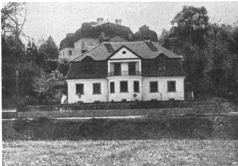
Abb. 17. Heutiger Blick auf die Hauptfassade des Schlosses Steinhof in Luzern. Moderne Villen umstellen heute das Schloss bis auf wenige Meter in der Umgebung. — Fig. 17. Aujourd'hui des villas modernes qui s'avancent jusqu'à quelques mètres du château, en cachent complètement la façade et défigurent le paysage.

Das Schloss Steinhof in Luzern. Von alters her galt der sog. Obergrund, der sich in weitem Umfang südlich der Stadt hinzieht,