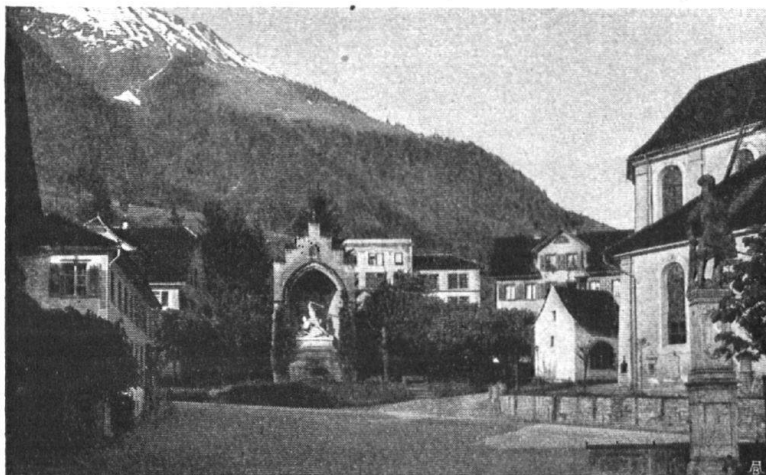
Abb. 19. Früheres Platzbild in Stans: das flach eingedeckte Schulhaus fügte sich dem Gesamtbild nicht gut ein. — Fig. 19. Vue de la place du village, à Stans, telle qu'elle était jadis. Le toit en terrasse de la maison d'école jure avec le style général des autres bâtiments.

In dieser Behörde war er der einzige, der beim Herannahen der eidgenössischen Truppen die Flucht verschmähte. „Ein Soldat flieht nicht,“ soll er barsch auf die unwürdige Zumutung erwidert haben. General von Sonnenberg beschloss auf dem Steinhof sein wechselvolles, reiches Leben am 26. März 1850.