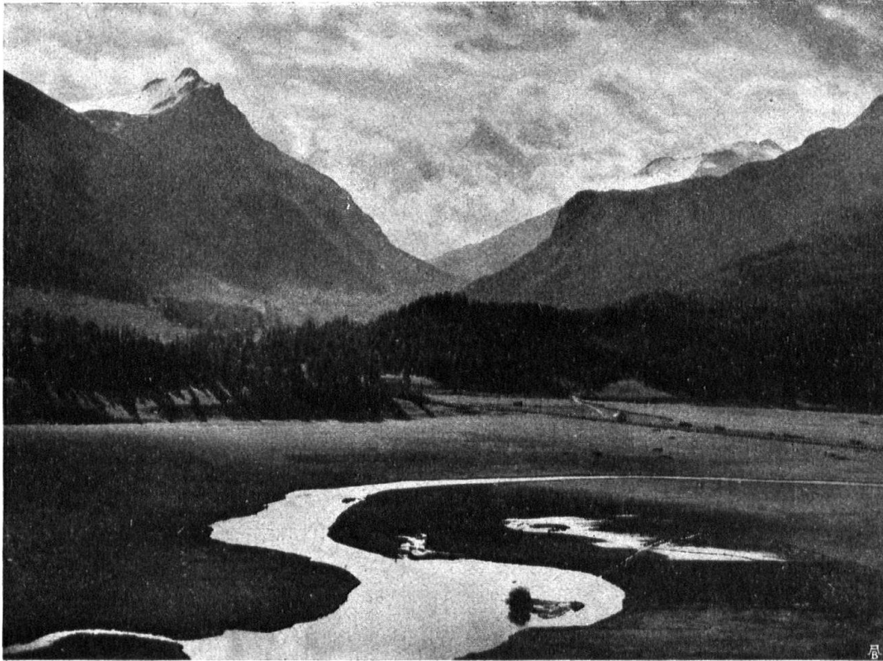
Abb. 14. Der Inn zwischen Celerina und Samaden. Blick gegen Pontresina und Berninapass. — Fig. 14. L'Inn entre Celerina et Samaden. Vue sur Pontresina et le col de Bernina.

ist es sehr fraglich, ob sichere Gewähr für die Unveränderlichkeit der Uferlinie in der schönen Jahreszeit geboten werden könnte. Das Kraftbedürfnis würde wohl stets vorgehen und später immer wachsen! Denn wenn nicht auf das Minimum des regelmässigen Wasserzuflusses in den See (als Garantie des Normalwasserstandes) abgestellt wird, was wasserwirtschaftlich nicht vorteilhaft ist, so fehlt es an einer sichern Gewähr für Beibehaltung der jetzigen Uferlinie.