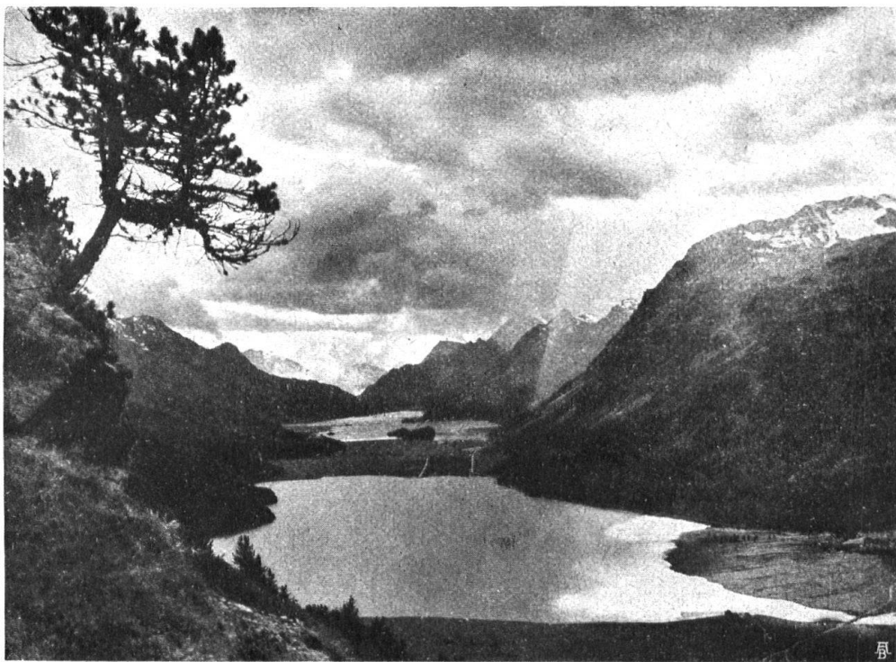
Abb. 13. Blick auf den Silvaplanner- und den Silsersee. Von Hahnensee aus gesehen. — Fig. 13. Les lacs de Silvaplana et de Sils, vus du „Hahnensee“.

Gedanken einer Absenkung des Silsersees während der wasserarmen Winterzeit und seiner Wiederauffüllung „während der Sommersaison“ zur Grundlage hat.