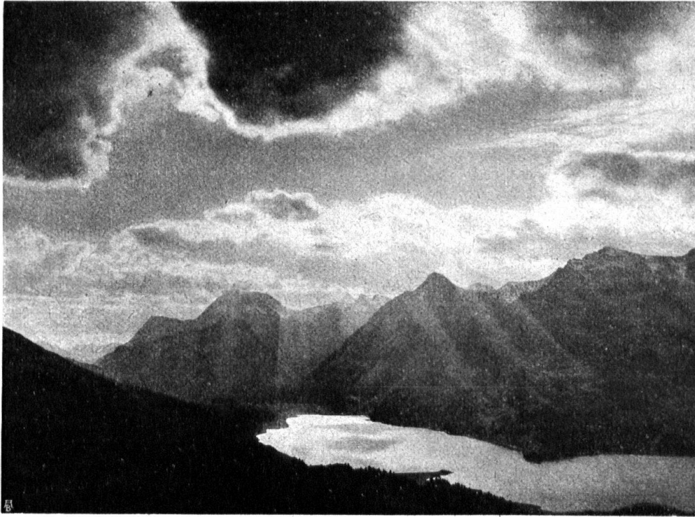
Abb. 12. Gewitter über dem Silsersee. Blick von Marmorè, oberhalb Sils; im Hintergrund Maloja. — Fig. 12. Le lac de Sils. Vue de Marmorè, au-dessus de Sils, par un temps d'orage. Au fond Maloja.

schlag dieser Oberexperten fussen, der schon alle wesentlichen Elemente zur Klarlegung der unabwiesbaren Gefährdung der Seen enthält.