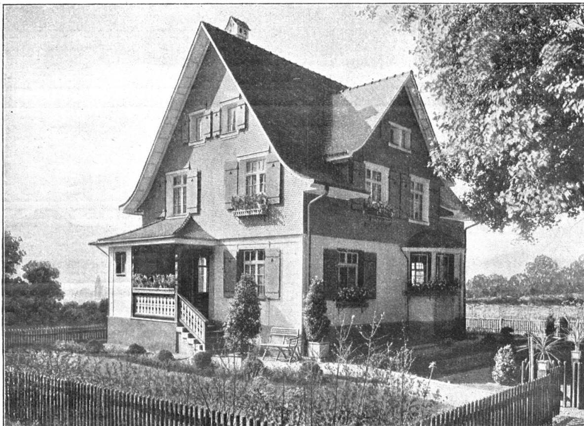
Eternithaus an der Schweiz. Landesausstellung in Bern. Goldene Medaille.