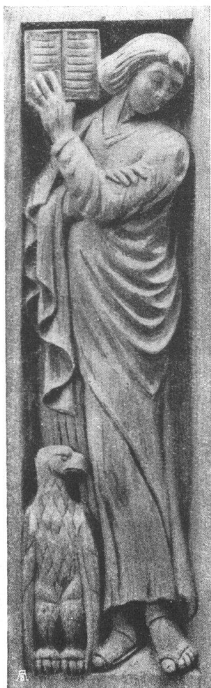
Abb. 21. St. Johannes. Evang. Holzgeschnitzte Kanzelfüllung. Von Carl Fischer, S. W. B., Zürich. — Fig. 21. Saint Jean, l'Évangéliste, sculpture en bois, décoration de chaire, par Carl Fischer, S. W. B., Zurich.

phique, ceci pour les conférenciers qui veulent traiter spécialement certaines contrées de la Suisse. On s'aperçoit malheureusement en parcourant ce chapitre-ci, que notre collection a encore de nombreuses lacunes, surtout pour les cantons d'Aarau, de Fribourg, de Genève, de Glaris, de Neuchâtel, de Soleure, du Tessin, de Vaud et de Zurich. Il serait vivement à souhaiter que les sections qui gardent pour elles-mêmes leurs clichés ou qui n'en possèdent pas encore, suivissent le louable exemple d'autres sections plus généreuses et qui ont envoyé leurs clichés en dépôt à l'Office central du Heimatschutz à Berne, 44, Mittelstrasse. (Pour tous les nouveaux clichés le format 8½ : 10 est désiré.) Ces clichés sont classés à l'Office