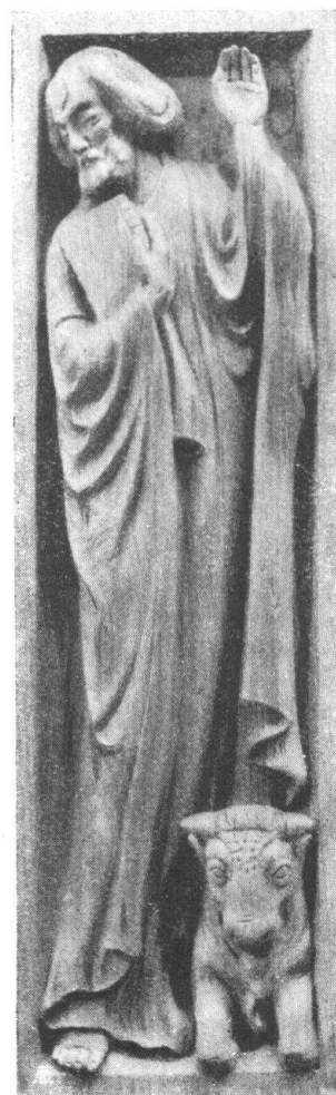
Abb. 22. St. Lukas. Kanzelfüllung. Wie das Pendant Abb. 21 für die protestantische Kirche in Cham. — Fig. 22. Saint Luc, pendant du précédent, sculpture en bois, décoration de la chaire pour l'église protestante de Cham.

Chaque section est priée, vu nos frais considérables d'impression, de se procurer