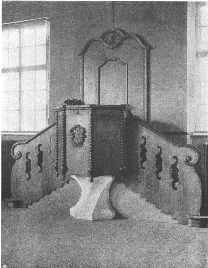
Abb. 20. Kanzel im Saal für Gottesdienste in Oftringen. Gediegene Holzarchitektur nach den Entwürfen von Joss und † Klauser, Arch. B. S. A. in Bern. — Fig. 20. Chaire destinée à une salle de prières à Oftringen. Bonne architecture en bois de MM. Joss † et Klauser, architectes, à Berne.

minait par les thèses ci-après, qui prouvent avec quelle hauteur de vues le Conseil des Etats a traité la question, dont l'importance, beaucoup plus grave qu'une simple affaire économique, a également été relevée par le Conseil fédéral.