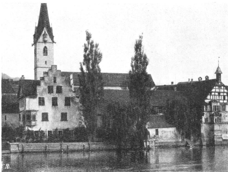
Abb. 14. Beim Kloster zu Stein am Rhein. Das Ufer und seine hölzerne Schutzwahr vor der Anlage der Mauer. — Fig. 14. Paysage et couvent de Stein au Rhin: La rive du fleuve avec l'ancienne palissade de bois.