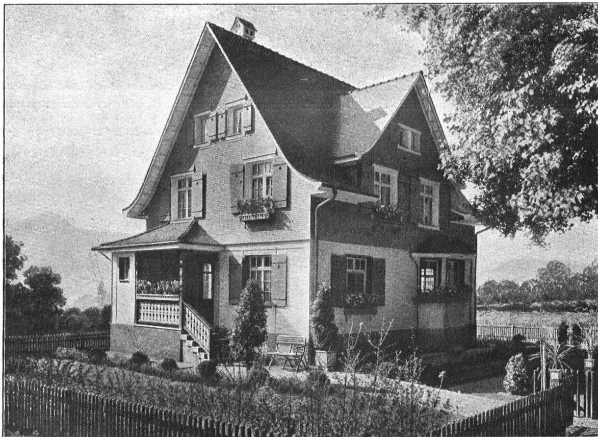
Eternithaus an der Schweiz. Landesausstellung in Bern. Goldene Medaille.

Buch- u. Kunstdruckerei Benteli A.-G., Bümpliz