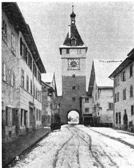
Abb. 16. Obertorturm in Neunkirch. Heutiger Zustand. Die überflüssige Dekorationsmalerei ist beseitigt und der Turm erscheint wehrhaft und schlicht wie ehemals. Aufnahme von C. Koch. — Fig. 16. La tour de la Porte supérieure à Neunkirch dans son état actuel. Les décorations superflues ont été supprimées. La tour a beaucoup gagné en retrouvant son air simple et martial.

Mitteilungen aus der Sektion Schaffhausen. 1 Anstrich von Hausfassaden. Der neue Brauch, Hausfassaden mit Oelfarbe zu streichen, hat sich auch in Schaffhausen stark eingebürgert. Die technische Leichtigkeit, eine solche Arbeit durchzuführen, birgt leicht die Gefahr in sich, dass ohne jegliche künstlerische Ueberlegung gehandelt wird. Die Vereinigung der Schaffhauser Architekten will nun hier beratend und korrigierend eingreifen und durch Aufstellen von Grundsätzen den ausführenden Handwerkern eine Wegleitung bei Renovation solcher Häuserfronten geben. Es ist geplant, in einem freien Diskussionsabend zwischen Malermeistern, Architekten und Kunstmalern eine gegenseitige Aussprache über die künstlerische Seite dieses Problems herbeizuführen.