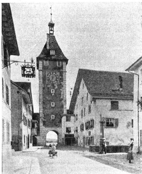
Abb. 15. Obertorturm in Neunkirch. Vor der Wiederherstellung. Man beachte die im Anfang des 19. Jahrhunderts aufgemalte hässliche Quader- und Eckbinder-teilung. — Fig. 15. La tour de la Porte supérieure à Neunkirch, avant la rénovation. Remarquer les laides imitations peintes de pierres de taille.