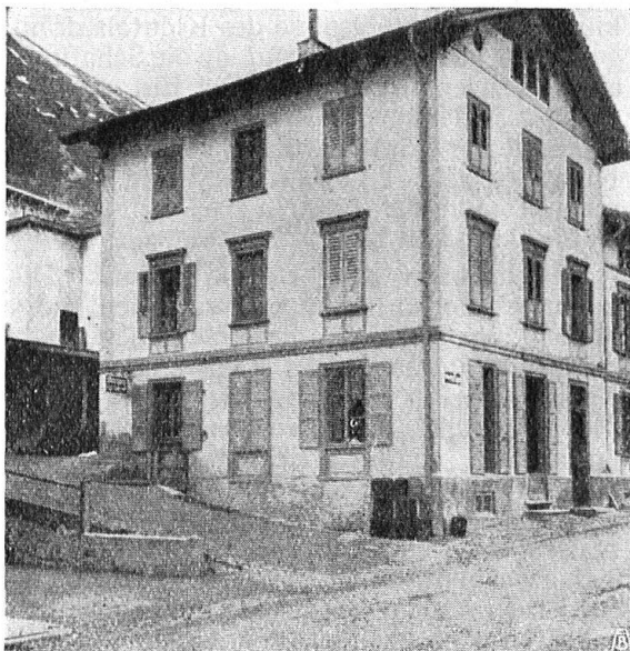
Fig. 16. L'ancienne maison de Pontresina qui a fait place au monumental Hôtel Rosatsch. Pour une fois un vieux bâtiment bien remplacé. — Abb. 16. Haus in Pontresina, das nun im stattlichen Neubau des Hotels Rosatsch aufgegangen ist. Für einmal kein schlechter Tausch.

schon seit Jahren vor dem unsinnigen Wettlauf im Bau von Hotelkasten gewarnt haben, aber kein Gehör fanden! Ganz abgesehen von den schlimmen ökonomischen Folgen dieser