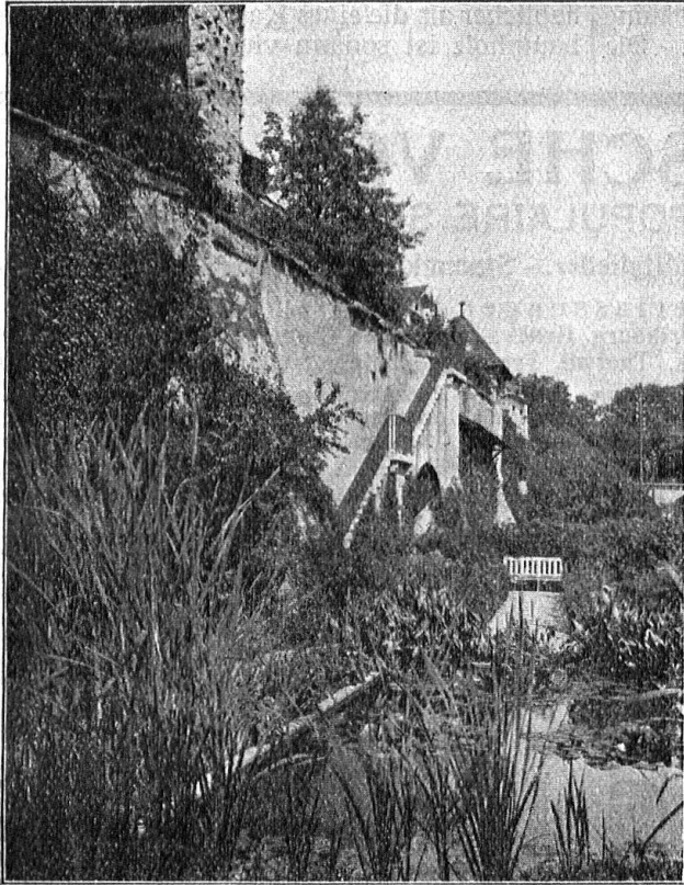
Vegetationsbild im Teich vor einer alten Mauer

OTTO FREIBEL'S ERBEN Gartenarchitekten, ZÜRICH 7