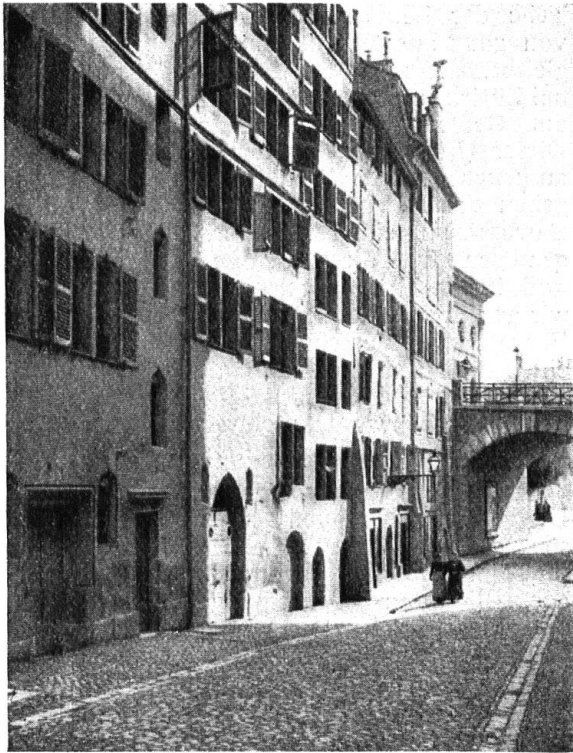
Abb. 13. Hausfassaden aus dem Mittelalter, in der Rue Saint-Léger zu Genf. Vor der Restauration. — Fig. 13. Façades datant du moyen âge dans la rue Saint-Léger, à Genève. Avant la restauration.

le soin des malades, mais une sorte d'asile de nuit pour les passants sans abri.