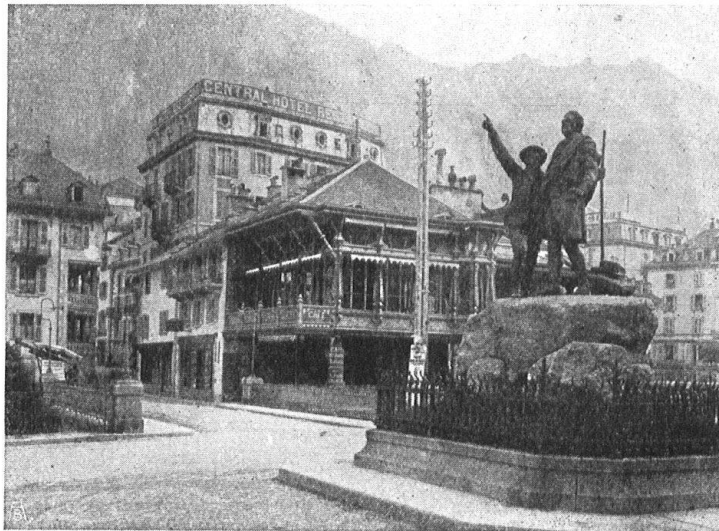
Abb. 11. Das Saussure-Denkmal in Chamonix. Die Gruppe der Montblanc-Besteiger H. B. de Saussure und J. Balmat — inmitten von Leitungsdrähten und -Masten auf dem, von geschmacklosen Hotel- und Restaurantbauten eingerahmten Dorfplatz von Chamonix. — Fig. 11. Le monument Saussure à Chamonix. Statues des conquérants du Mont-Blanc H.-B. de Saussure et J. Balmat entourées de poteaux de transmission, d'hôtels et de restaurants fort laids, sur la place du village, à Chamonix.

Basler Heimatschutz. Die Christoph Merian'sche Stiftung in Basel besitzt vor der Stadt und auf basellandschaftlichem Gebiet einen ausgedehnten Landkomplex mit verschiedenen Pachthöfen und andern Gebäulichkeiten. Die den bürgerlichen Behörden unterstellte Verwaltungskommission ist bestrebt, auf ihren Terrains die Tendenzen des Heimat- und Naturschutzes zu fördern. Sie duldet keine aufdringlichen