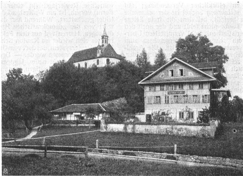
Abb. 9. Die Wallfahrtskapelle im Flüeli und das Gasthaus (früher zugleich Kaplanei) vor den Um- und Neubauten. — Fig. 9. La chapelle, lieu de pèlerinage, à Flüeli et l'hôtel, qui servait autrefois en même temps de cure, avant et après la reconstruction.