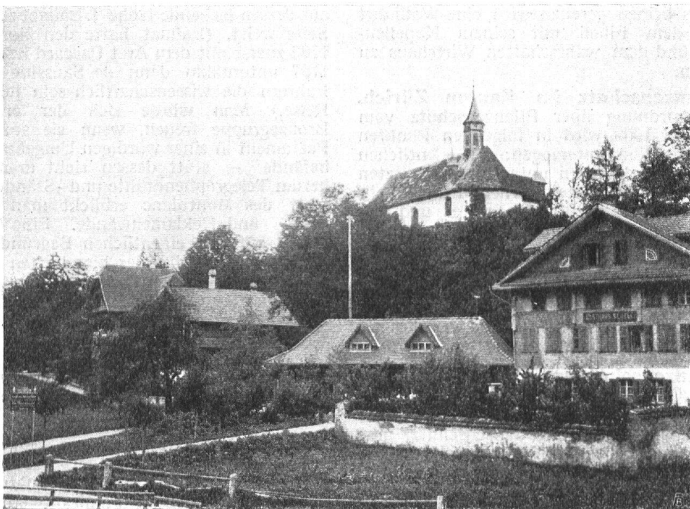
Abb. 10. Die Häusergruppe um den Kapellenhügel nach den erfolgreich durchgeführten Neuerungen. Die stattlichen Dächer wirken in der Landschaft eher belebend als störend. Fig. 10. Groupe de maisons autour de la chapelle, après les heureuses transformations qui ont été faites. Les toits de ces bâtiments animent le paysage plutôt qu'ils ne lui nuisent.