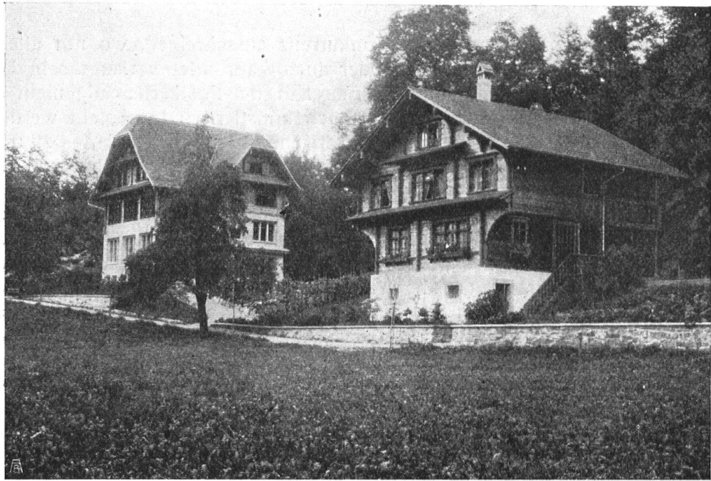
Abb. 7. Die Kaplanei im Flüeli. Neben dem Schulhaus wurde die Kaplanei im Sinne alter obwaldischer Bauernarchitektur gebaut. Das, an den Fensterpartien schön verzierte Holzwerk passt sich der baumreichen Umgebung trefflich an. Architekten Omlin , Sachsels , und Schneider , Baden. — Fig. 7. Cure à Flüeli. Non loin de la maison d'école, la cure a été construite dans le style rustique d'Obwald. Les motifs de décoration en bois des fenêtres s'accordent parfaitement avec le caractère du pays riche en forêts. Architectes MM. Omlin à Sachsels et Schneider à Baden.