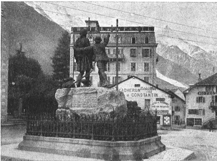
Abb. 12. Das Saussure-Denkmal in Chamonix. J. Balmat zeigt dem Naturforscher den Hochgipfel — der allerdings von einem Hotelkasten und von Plakatwänden im Vordergrund verdeckt wird. — Fig. 12. Le monument Saussure à Chamonix. J. Balmat montre à l'ascensioniste la cime du Mont-Blanc, cachée il est vrai par un hôtel et une façade garnie de réclames.

Der berühmte „letzte Platz“, bis auf den das Theater gefüllt sei, spielt in den durchwegs freundlichen Zeitungsstimmen über unser Theater eine grosse Rolle. Das Publikum war an allen den bisherigen Spielabenden von aufmunternder Beifallsfreudigkeit, die den Stücken — dem „Chlupf“, dem „Abesitz“, dem „Spinnet im Lischebedli“ — galt, den Spielern und sicher auch der Ausstattung, für die sich R. Münger besondere Verdienste erwarb. Der glänzend stimmbegabte Sänger H. Indergand hat im „Röselgarten“ mit seinen Volks- u. Söldnerliedern