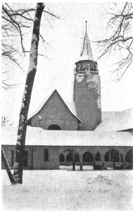
Abb. 20. Die kath. Kirche mit Kreuzgang, aus Gruppe 54 (Kirchl. Kunst) im Dörfli. K. InderMühle, Architekt B. S. A.

Fig. 20. Eglise catholique avec cloître. Faisant partie du groupe 54 (art d'église) du Village.