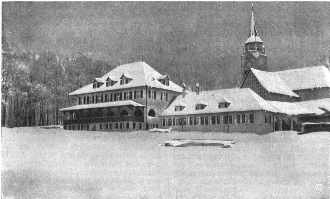
Abb. 23. Das Dörfli von Süden. Wirtshaus zum Röseligarten und Bazar (Gr. 49) und Kirche (Gr. 54). K. InderMühle , Architekt B. S. A. Fig. 23. Le Village vu du sud. L'auberge du „Röseligarten“, le bazar (gr. 49) et l'église (gr. 54).