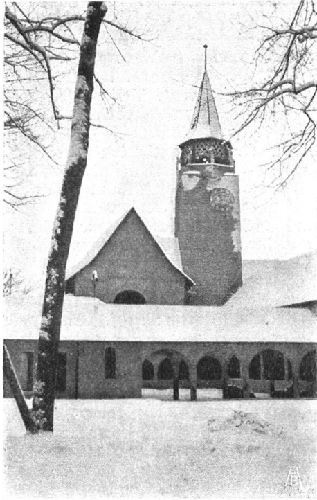
Abb. 20. Die kath. Kirche mit Kreuzgang, aus Gruppe 54 (Kirchl. Kunst) im Dörfli. K. InderMühle, Architekt B. S. A.