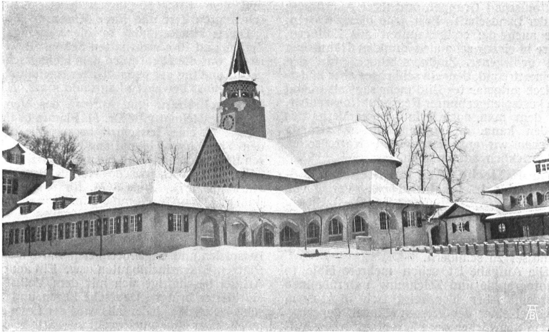
Abb. 22. Das Dörfli von Südosten. Vorn die Bauten für Bazar und Heimkunst (Gruppe 49), darüber die Kirche (Gr. 54). K. InderMühle , Architekt B. S. A. Fig. 22. Le Village vu du sud est. Au premier plan les bâtiments du bazar et de l'industrie à domicile (groupe 49), en arrière, l'église (groupe 54).