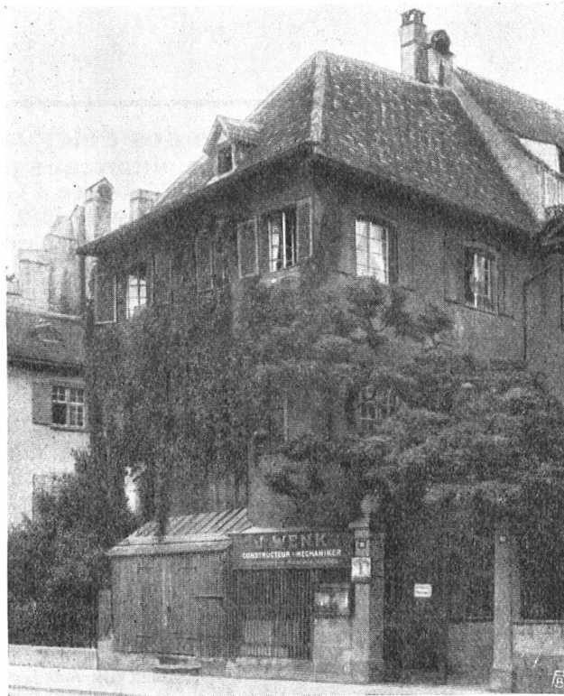
Abb. 18. Altes Haus am Petersgraben zu Basel. Vor dem Umbau reich mit Grün überwachsen. Der malerische Gesamteindruck ging später durch zwei Umbauten ganz verloren.