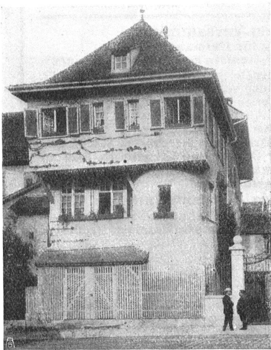
Abb. 19. Durch einen ersten Umbau wird die Bewachung fast beseitigt, die interessante Bauweise aber deutlicher gezeigt. Das Holzgitter hat etwas vom Reiz der frühern Anlage bewahrt. — Fig. 19. Une première transformation supprime presque entièrement le feuillage, mais met par contre en évidence le caractère intéressant de l'architecture. La grille en bois a conservé quelque chose du cachet de l'ancienne grille.