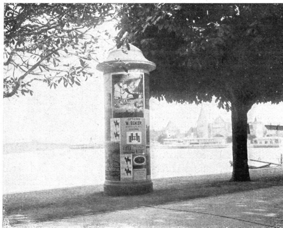
Schlechtes Beispiel. Neue Plakatsäule in Luzern. In aufdringlicher Weise zwischen den Promenadenweg und den See hingepflanzt. — Mauvais exemple. Nouvelle colonne d'affichage à Lucerne. Placée d'une façon très déplaisante entre la promenade et le lac.

Redaktion: Dr. JULES COULIN, BASEL, Eulerstrasse 65.