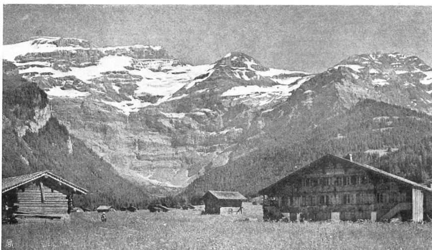
Ferme vaudoise et vue des Diablerets. Waadtländer Bauernhaus mit Blick auf die Diablerets.