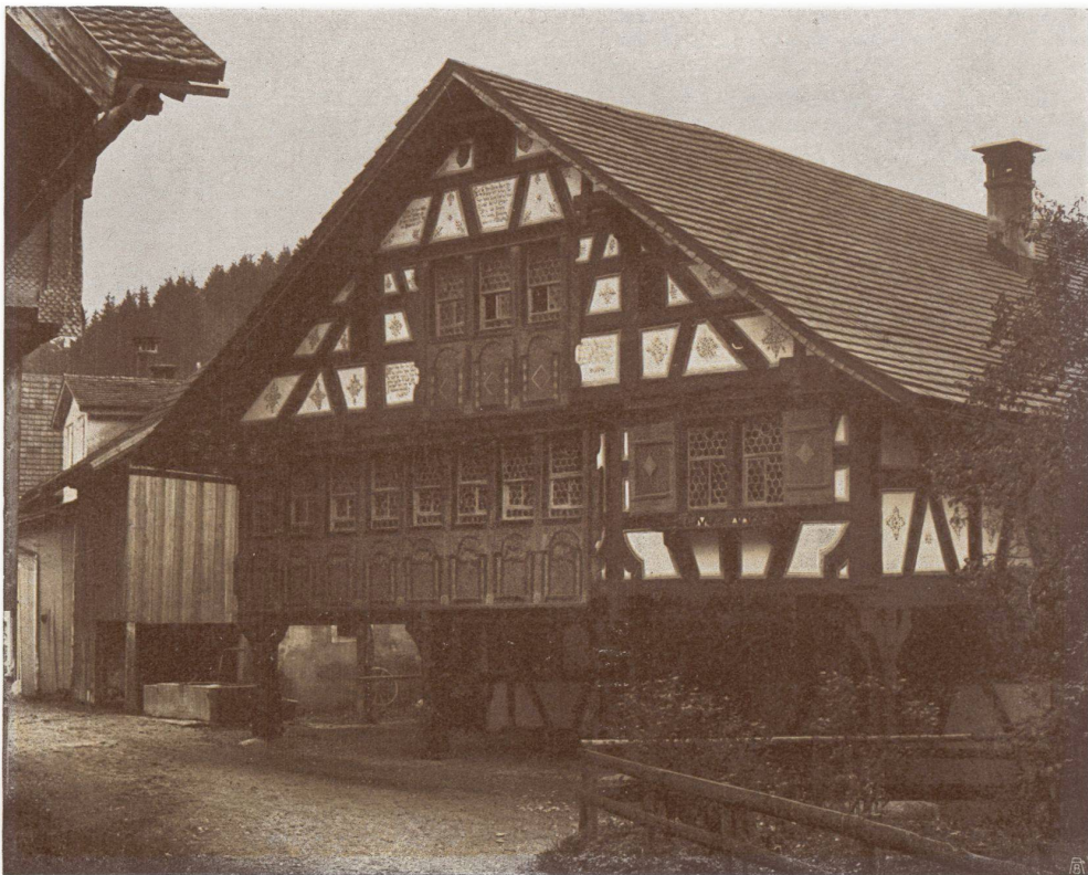
L'HOTEL DE VILLE A BURGAU Restauré par la section de Saint-Gall de la Ligue.