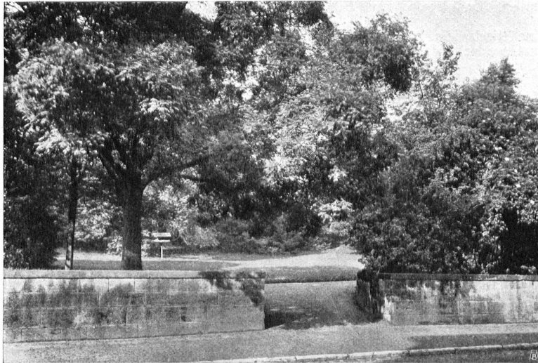
WARUM ICH AUS MEINER WOHNUNG AUSZOG. X. Y. — Aussicht aus den Fenstern der neuen Wohnung

Menschen. Etlich Kirchtürme ragen in der Ferne empor, und der wunderbar gelegene, burgähnliche Seelenhof zu Buchs schliesst den Talblick ab. Ueber alles aber ragen die Berge, Schnee tragen sie in ihren schwarzen Falten. Und dann die Sonne, die ewige Sonne!