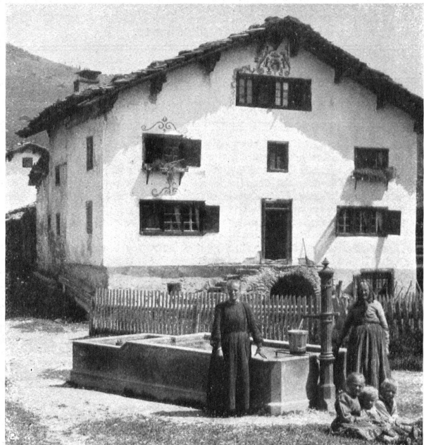
GEGENBEISPIEL: Neuer Dorfbrunnen in Brigels (Graubünden) MAUVAIS EXEMPLE: Fontaine moderne à Brigels (Grisons)