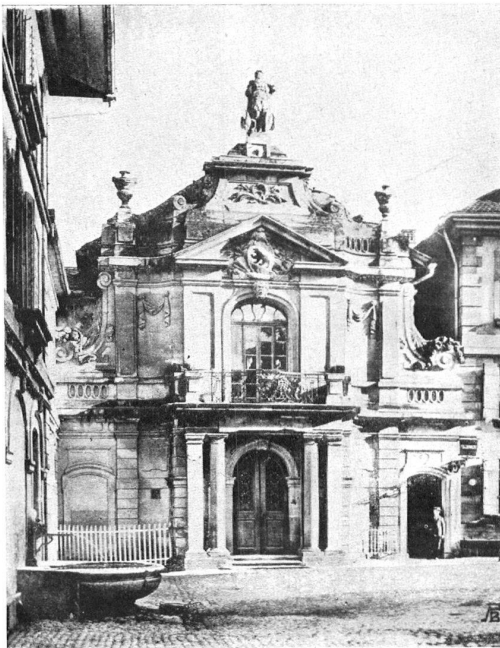
FAÇADE DES ALTEN HISTORISCHEN MUSEUMS IN BERN. Ein Meisterwerk der Baukunst, 1772–1776 von Sprüngli geschaffen, das in Gefahr schwebt abgebrochen zu werden. FAÇADE DE L'ANCIEN MUSÉE HISTORIQUE À BERNE. Chef-d'œuvre menacé de démolition.