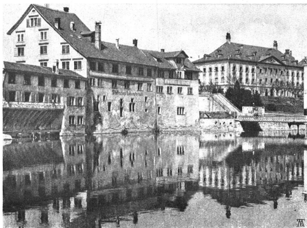
ALTE HÄUSER AM LINKEN UFER DER LIMMAT ZU ZÜRICH, die bald umfangreichen aber nötigen städtischen Neubauten werden weichen müssen ——— VIEILLES MAISONS SUR LA LIMMAT A ZÜRICH qui disparaîtront bientôt.

„Urwald“ im Emmental. Riesentannen stehen auf dem Gute Dürsrütti ob Langnau im Emmental. In der Höhe von etwa 900 Meter findet sich das grösste Exemplar von rund 40 Kubikmeter; würde es aufgezogen, so gäbe es wohl 20 Klafter Brennholz. Auf Brusthöhe hat die Tanne einen Umfang von 4,70 Meter. Bis auf die Höhe von 4 Meter ist dieselbe beinahe gleichstämmig. Das Alter wird auf 300 Jahre geschätzt. Das zweitgrösste Exemplar misst 35 Kubikmeter. Exemplare von 25 und 30 Kubikmetern finden sich mehrere. All dies grosse Holz ist trotz seines Alters vollkommen gesund.