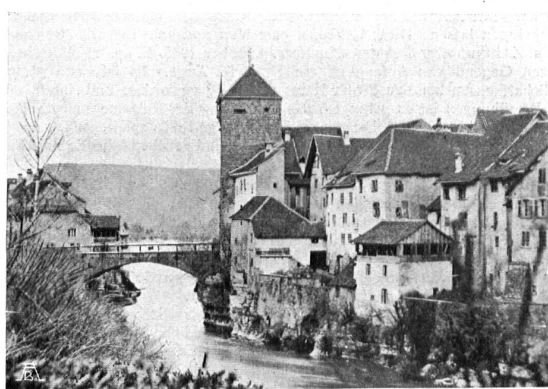
ALTE STEINBRÜCKE MIT TOR IN BRUGG VIEUX PONT EN PIERRE AVEC PORTE A BRUGG