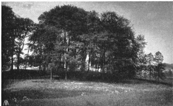
DAS BUCHENWÄLDCHEN BEI ST. FIDEN. Einziger reiner Laubholzbestand der Gegend, ein zukünftiger öffentlicher Park des Ostquartiers. Hoffentlich setzt die Bewegung zur Sicherung desselben bald ein LA FORÊT DES HÊTRES DE ST-FIDEN. Seule forêt de bois feuillu de cette contrée, propre à devenir le parc de l'Est. Espérons qu'on saura la conserver.

Vor zwei Jahren wurde über dieses interessante Naturdenkmal das Todesurteil durch Verkauf an einen Steinhauer gesprochen. Nach langen Verhandlungen ist nun ein Vertrag zustande gekommen, laut welchem die Gemeinde Monthey den Block und das ihn umschliessende Grundstück für rund 30000 Fr. erwirbt, wonach er als unveräusserliches Eigentum in den Besitz der Schweizerischen Naturforschenden Gesellschaft übergehen soll. Dieser Betrag mag für einen erratischen