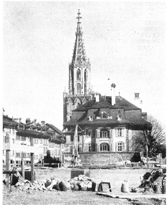
GUTES ALTES PRIVATHAUS AN DER HERRENGASSE IN BERN BELLE VIEILLE MAISON A LA RUE DES GENTILSHOMMES A BERNE

Die Mitglieder der Sektion Graubünden im Ausland, die den Jahresbeitrag pro 1907 noch nicht bezahlt haben, werden höflich gebeten, den Betrag von Fr. 3.— an den Kassier in Chur einzusenden.