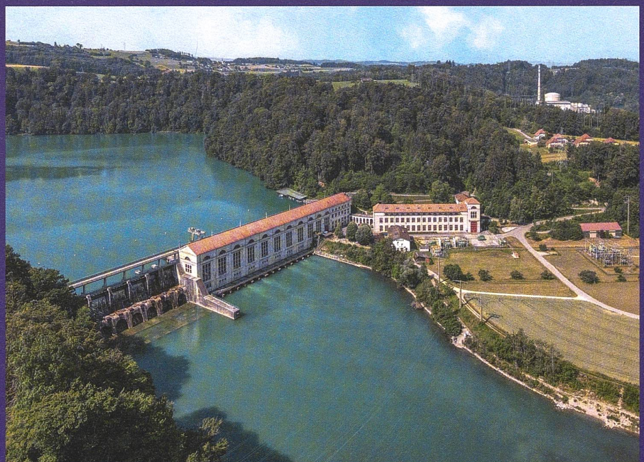
▲ 1 Die grossen Energieinfrastrukturbauten prägen die Mühleberger Landschaft wesentlich mit: Der Wohlensee mit dem 1917–1920 errichteten Wasserkraftwerk ebenso wie das 1972 fertiggestellte Kernkraftwerk (rechts im Hintergrund).

Jetzt bestellen unter: www.bau-kultur-erbe.ch